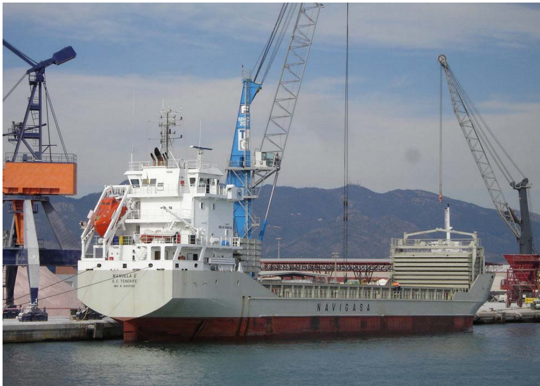
MANUELA E , En Castellón el 3 Diciembre 2007

071203 Primera escala en Castellón del MANUELA E