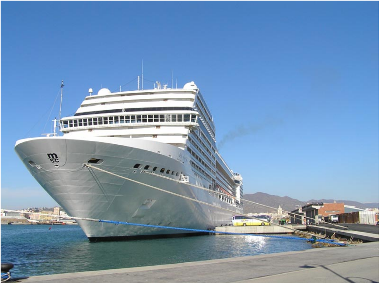
MSC MUSICA, en Málaga el 23 Noviembre 2007

071123 El buque de crucero MSC MUSICA atracó, a modo de prueba, en el nuevo muelle de Levante atraque sur, adosado a la nueva estación marítima de Málaga, aún en construcción. El buque atracó a las 06 horas procedente de Arrecife de Lanzarote zarpando con destino a Civitavecchia doce horas mas tarde