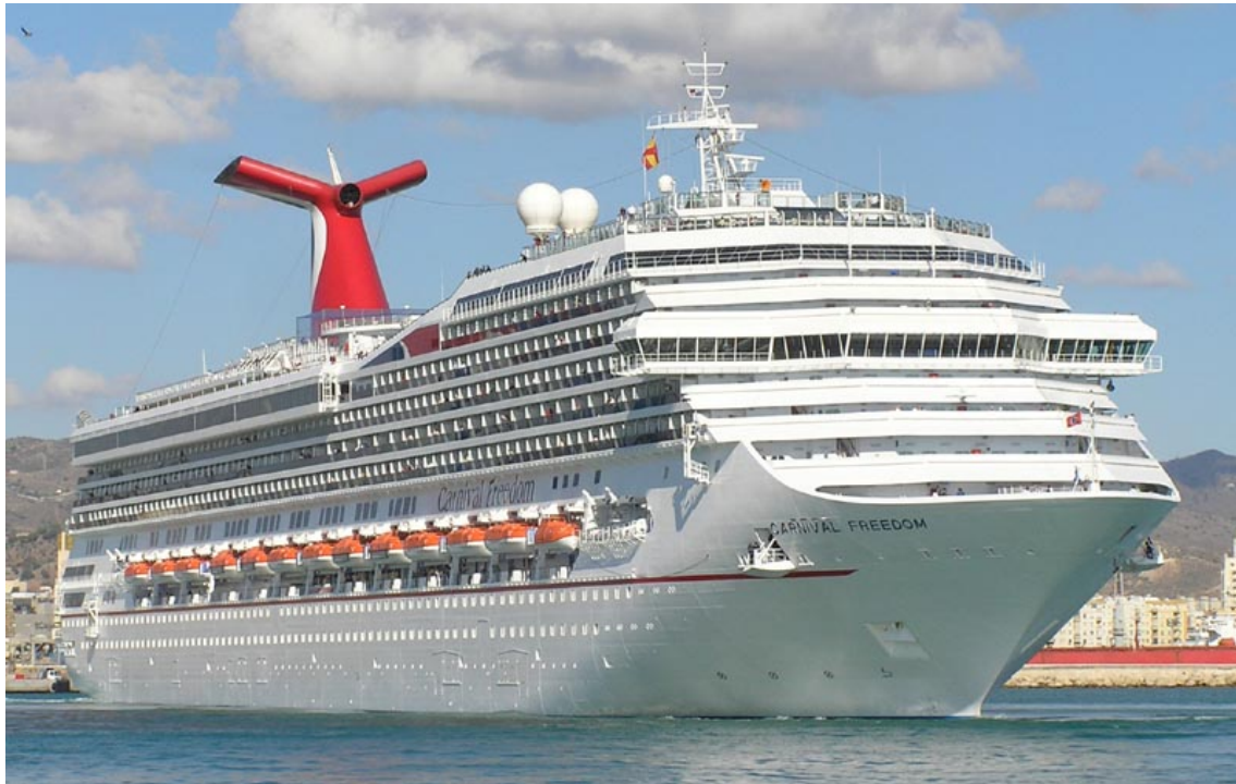
CARNIVAL FREEDOM , en Málaga el 1 Noviembre 2007