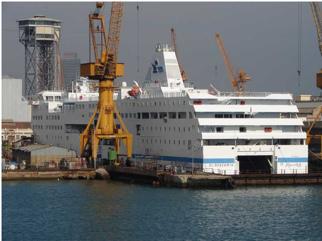
EL DJAZAIR II, en el dique de UNB el 6 Noviembre 2007