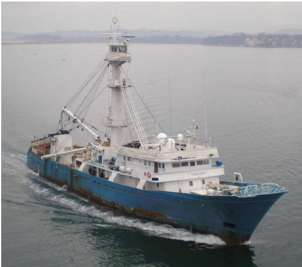
TXORI EDER, en Santander el 2 Noviembre 2007