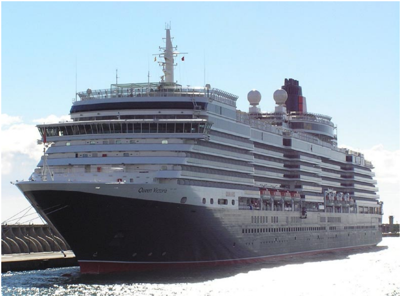
QUEEN VICTORIA , en Málaga el 26 Diciembre 2007 - ©Dr. Juan Carlos Cilveti Puche