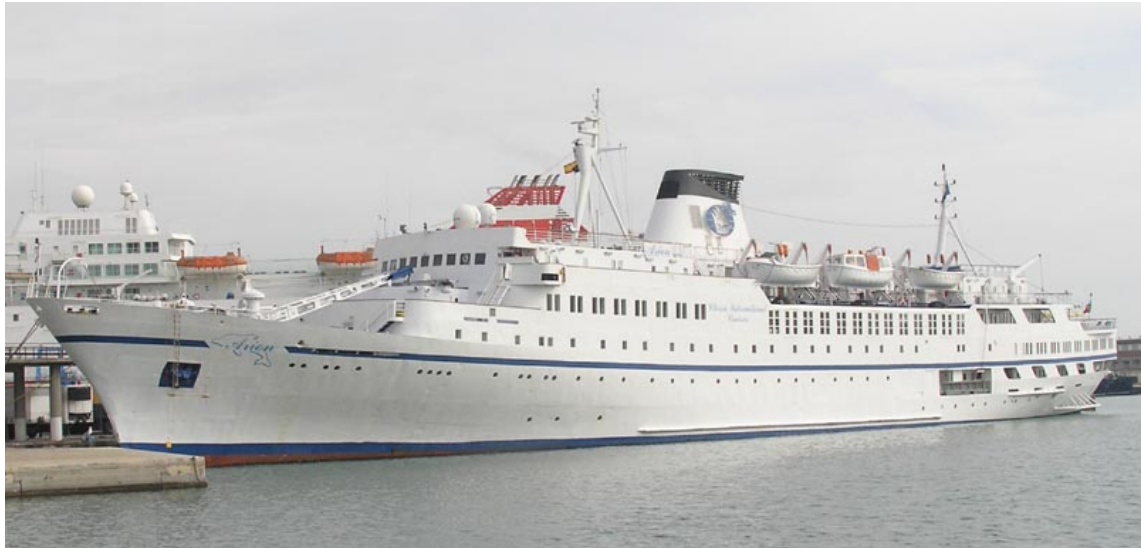
ARION, en Málaga el 9 Noviembre 2007