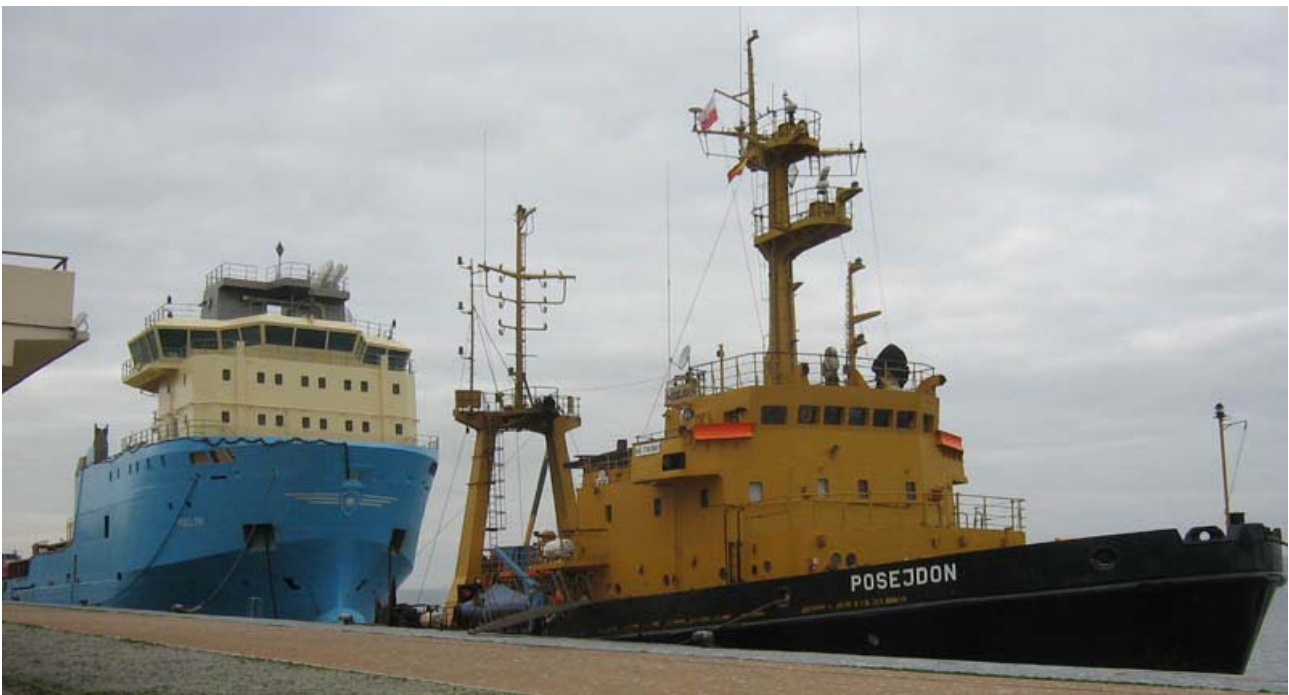
POSEJDON y HULL 119, en Vigo el 2 Diciembre 2007