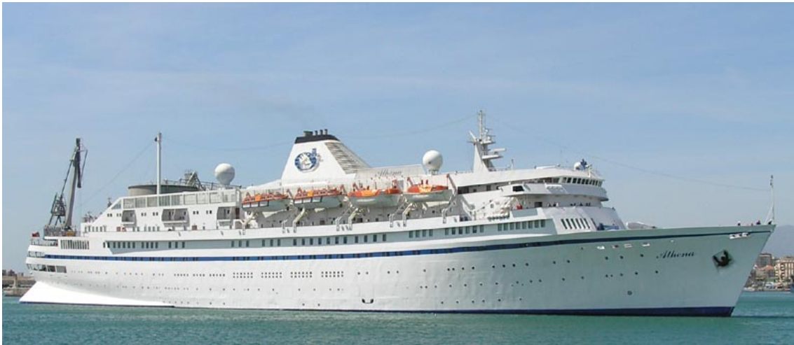
ATHENA, en Málaga el 22 Diciembre 2007

071222 A las 0600 horas, procedente de Lisboa, queda atracado en el muelle 3 A3 de Málaga el buque de cruceros ATHENA. Llegaba en sustitución del ARION, que estaba realizando una serie de cruceros semanales con base en Málaga a cargo del operador Vision Cruises. Zarpa para Funchal a las 1500 horas