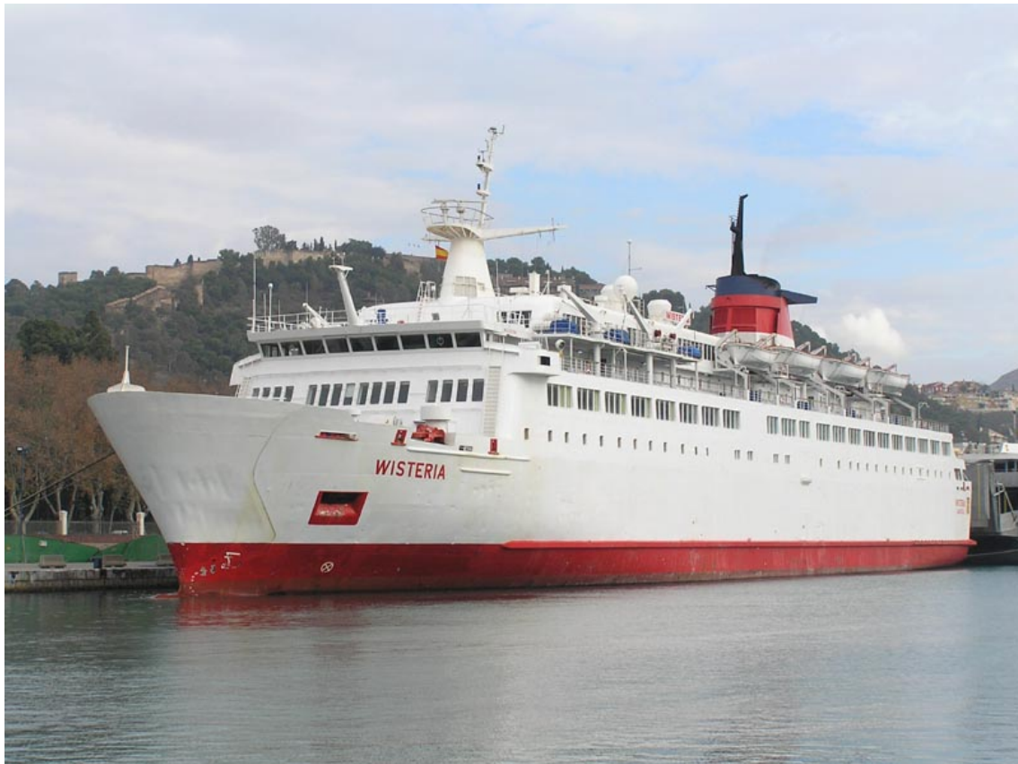
WISTERIA , en Málaga el 24 Diciembre 2007

071221 Llega a Málaga en escala técnica la corbeta Indonesia de nueva construcción KRI HASANUDDIN 366: Procedía de Vlissingen y al día siguiente continuó viaje hacia Jakarta