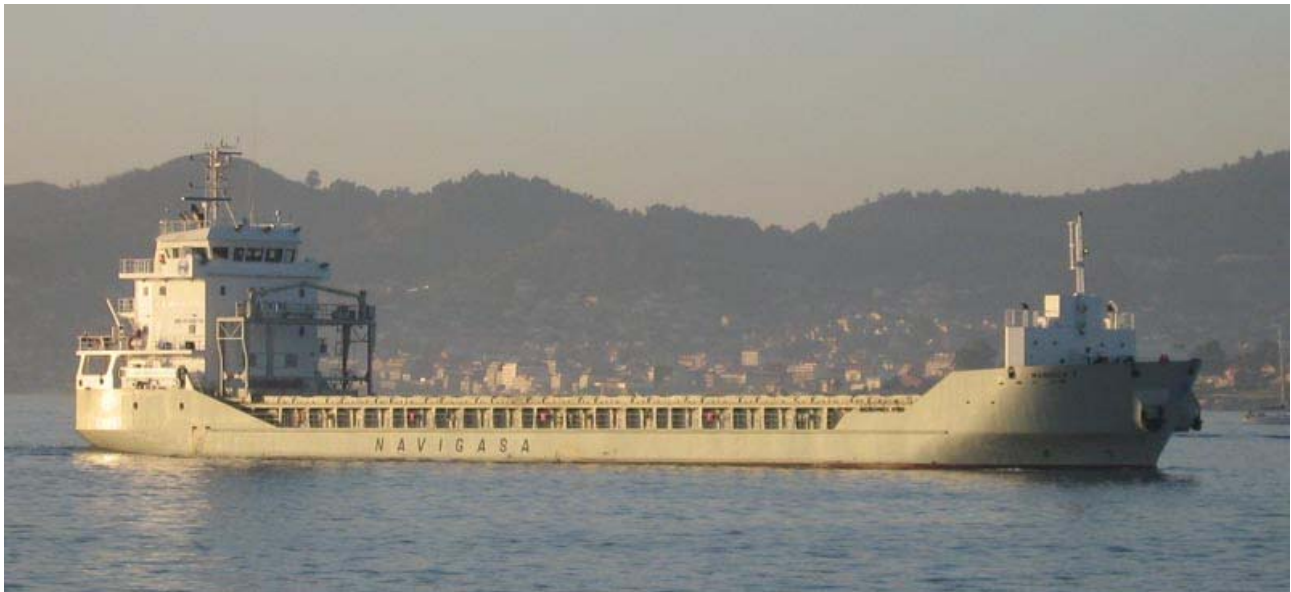
MANUELA E , En Vigo el 23 Diciembre 2007 - ©Francisco Díaz Guerrero

071223 Con un cargamento de sal procedente de Torrevieja, hace su primera escala comercial en Vigo del mercante español MANUELA E, recientemente entregado por un astillero local