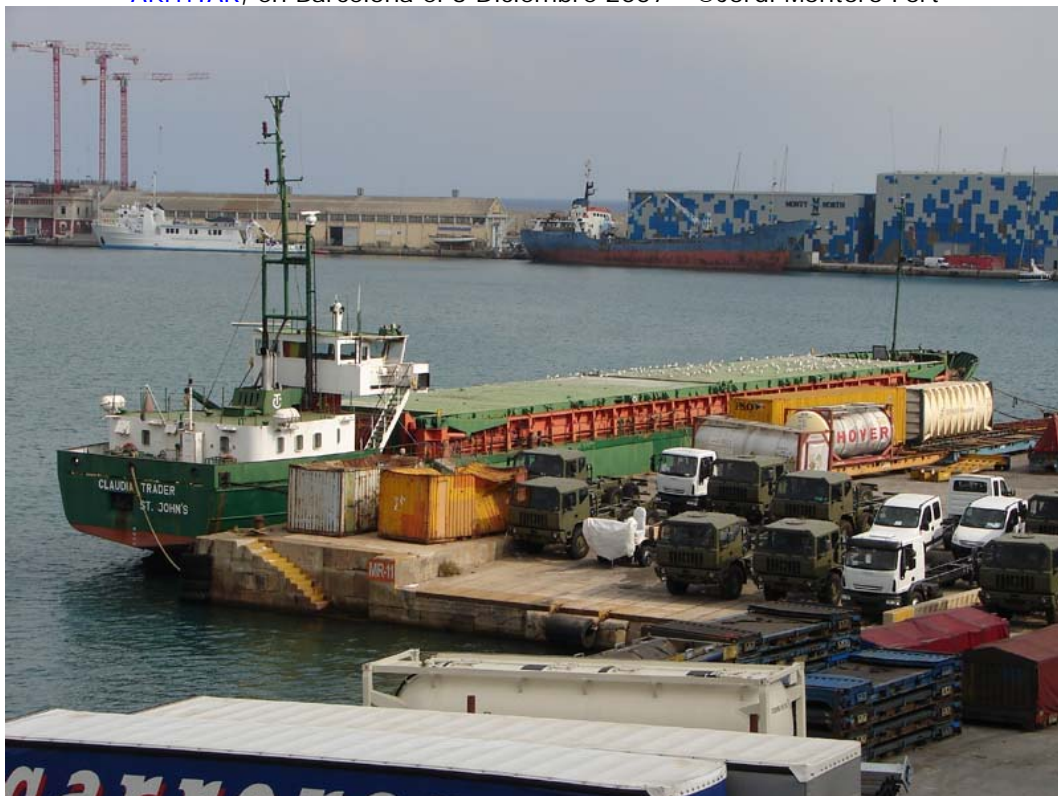
CLAUDIA TRADER , en Barcelona el 8 Octubre 2007