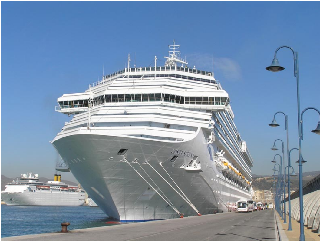
COSTA SERENA , en Málaga el 5 Diciembre 2007

071205 En Málaga sale de dique el frigorífico SIERRA CAZORLA quedando atracado en el muelle No.4. Dos días mas tarde zarpa a ordenes