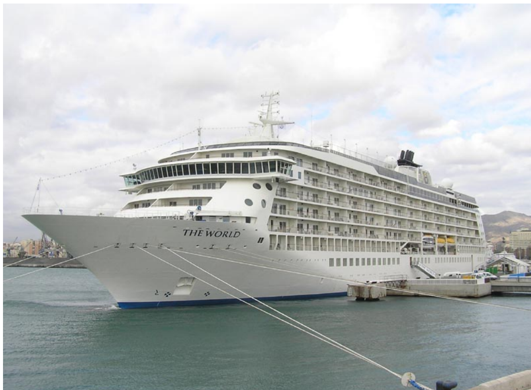
THE WORLD , en Málaga el 14 Diciembre 2007 - ©Dr. Juan Carlos Cilveti Puche