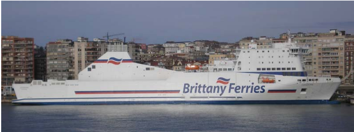
COTENTIN , en Santander el 2 Diciembre 2007

071203 Primera escala en Castellón del MANUELA E