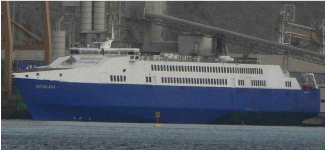
SILVIANA L en Santa Cruz de Tenerife el 24 Noviembre 2007