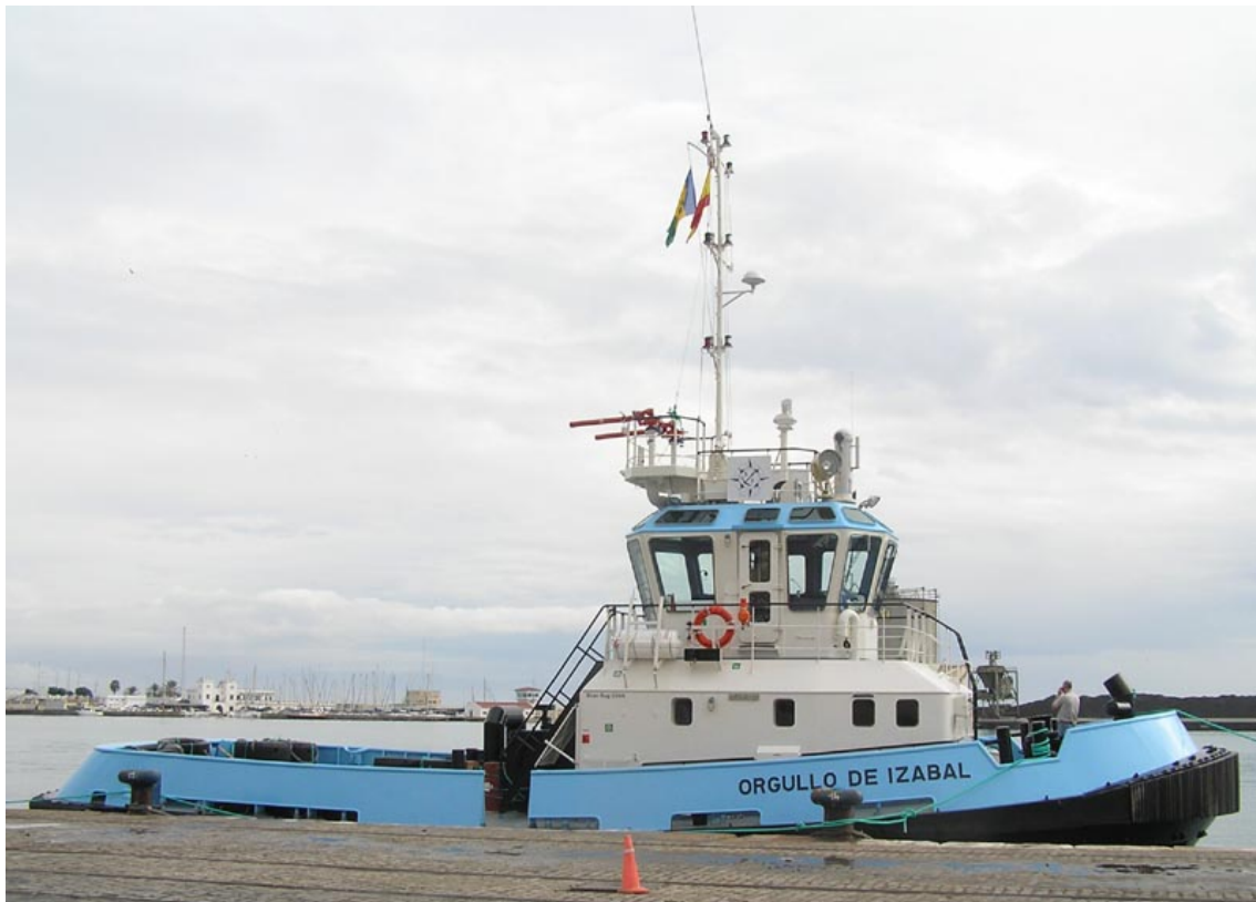
ORGULLO DE IZABAL , en Málaga el 23 Noviembre 2007

071121 Escala técnica en el puerto de Málaga del remolcador ORGULLO DE IZABAL , construcción 509624 de Damen Shipyards Galati, en viaje de Galatz a Mindelo y Santo Tomás de Castilla, su destino final