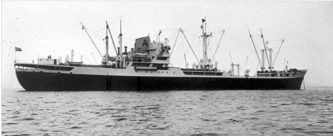
Otra vista del MONTE PALOMARES en Santander