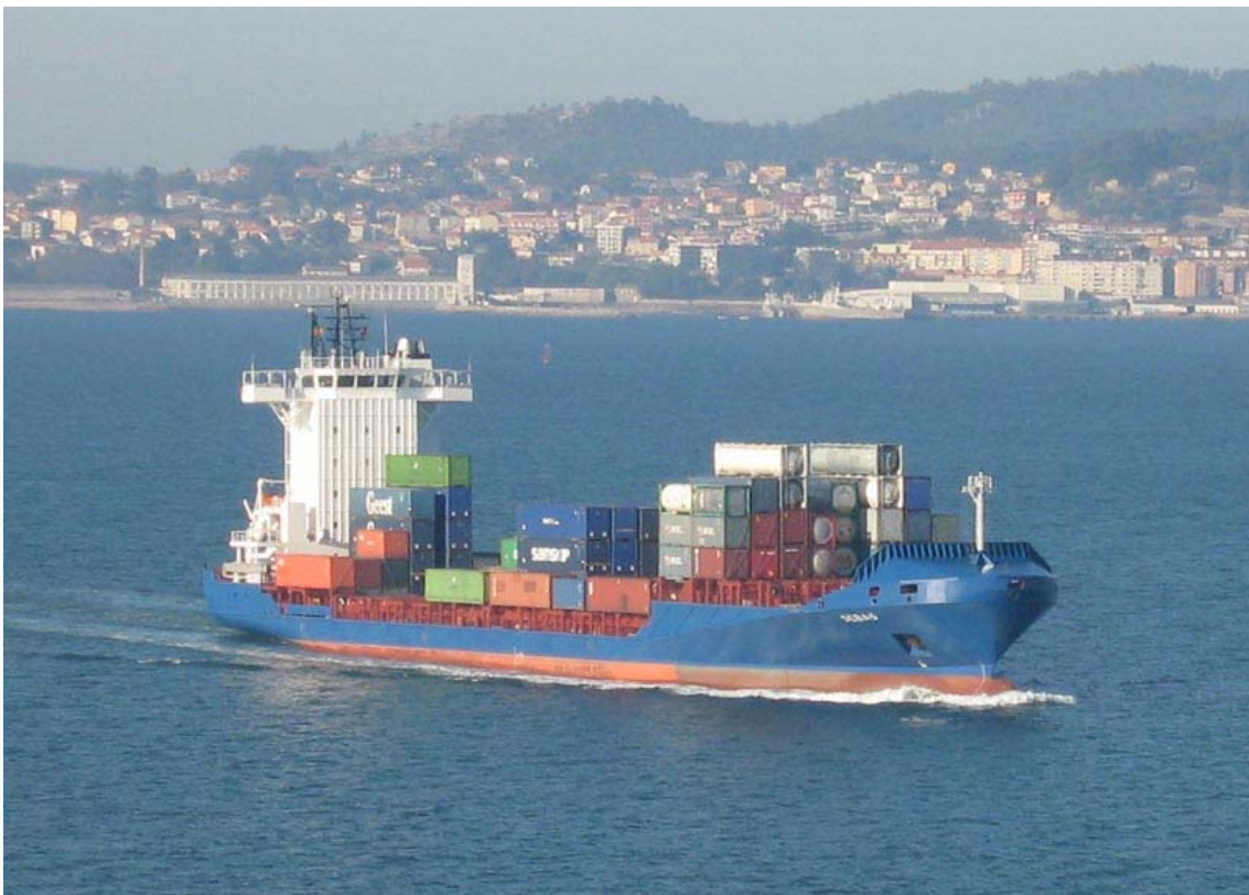
SEBAS , en Vigo el 23 Diciembre 2007

071223 Nueva escala en Vigo del portacontenedores abanderado en Antigua SEBAS, incorporado el pasado mes de Julio al servicio regular entre Róterdam y Lisboa