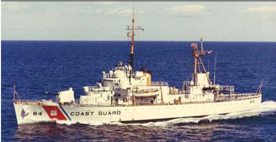
Uno de los rescatadores, el USCGC ESCANABA