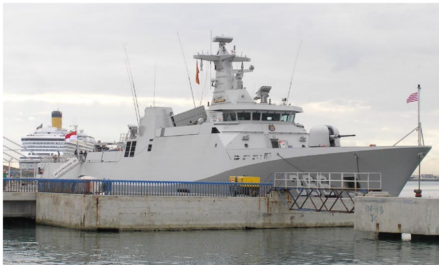
KRI HASANUDDIN , en Málaga el 24 Diciembre 2007

071221 Llega a Málaga en escala técnica la corbeta Indonesia de nueva construcción KRI HASANUDDIN 366: Procedía de Vlissingen y al día siguiente continuó viaje hacia Jakarta