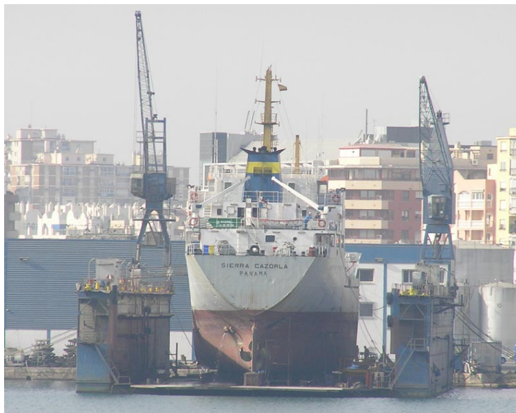
SIERRA CAZORLA , en Málaga el 9 Noviembre 2007

071205 En Málaga sale de dique el frigorífico SIERRA CAZORLA quedando atracado en el muelle No.4. Dos días mas tarde zarpa a ordenes