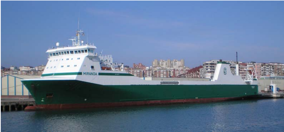
MIRANDA, en Santander el 8 Noviembre 2007

071206 Con motivo de la entrada en servicio del ro-ro MISANA hoy llega a Santander, en su última escala, el ro-ro MIRANDA. Ambos adscritos a la línea entre puertos de Finlandia, Ferrol y Santander