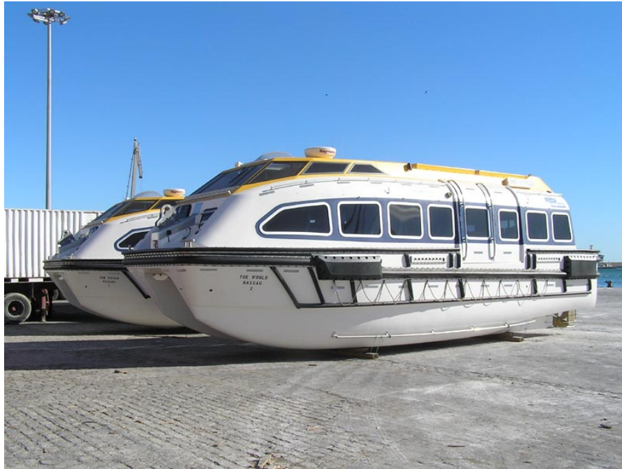
Tenders para el THE WORLD en el puerto de Málaga el 9 Diciembre 2007