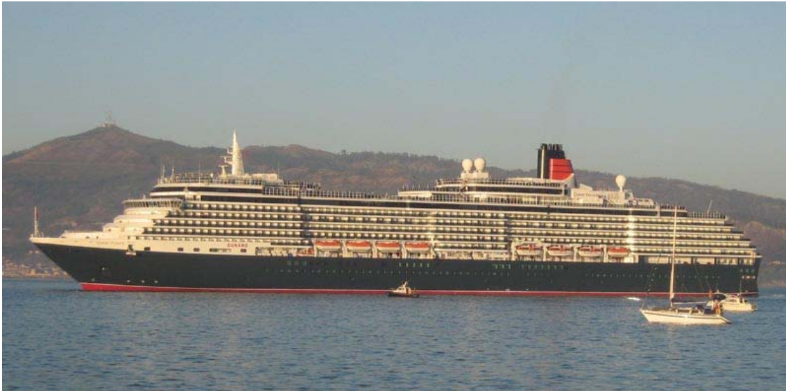
QUEEN VICTORIA , en Vigo el 23 Diciembre 2007

071223 Nueva escala en Vigo del portacontenedores abanderado en Antigua SEBAS, incorporado el pasado mes de Julio al servicio regular entre Róterdam y Lisboa