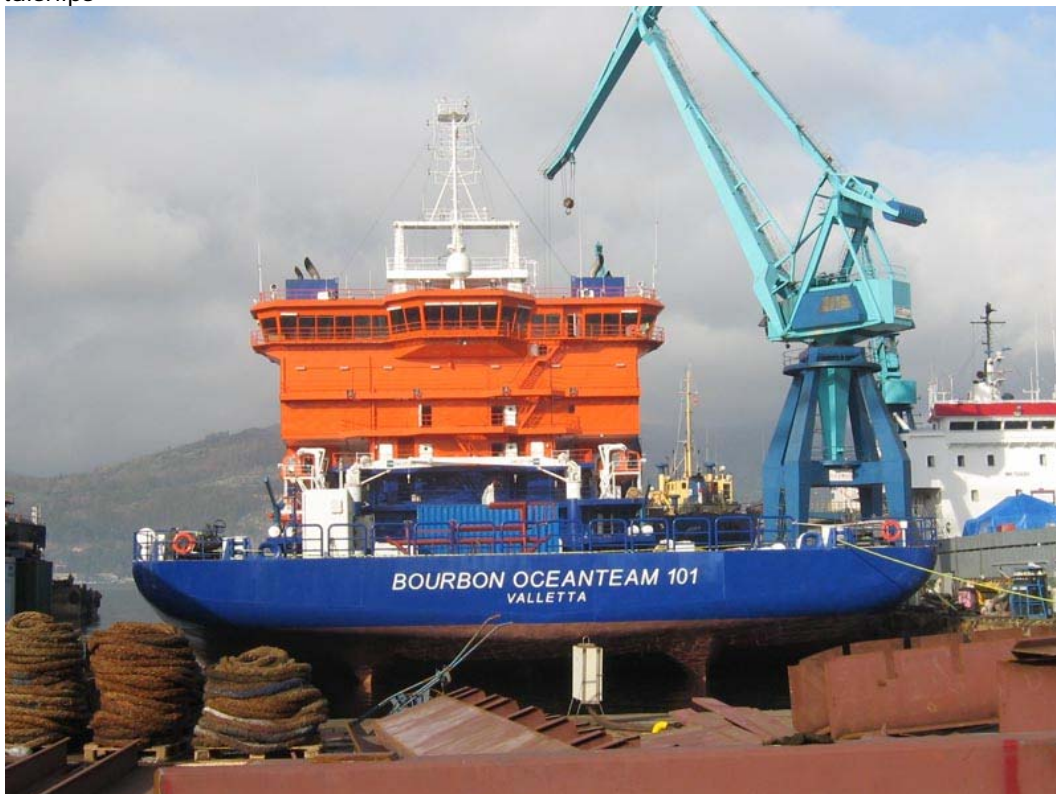
BOURBON OCEANTEAM 101, en armamento el 6 Diciembre 2007

071206 Zarpa de Vigo el buque de apoyo BOURBON OCEANTEAM 101, nueva construcción del astillero Metalships