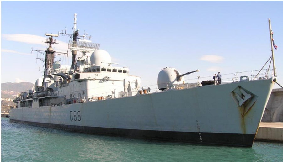
EXETER , en Málaga el 23 Noviembre 2007

071121 Primera escala en Mahón del VEMAOIL XXV con fuelóleo