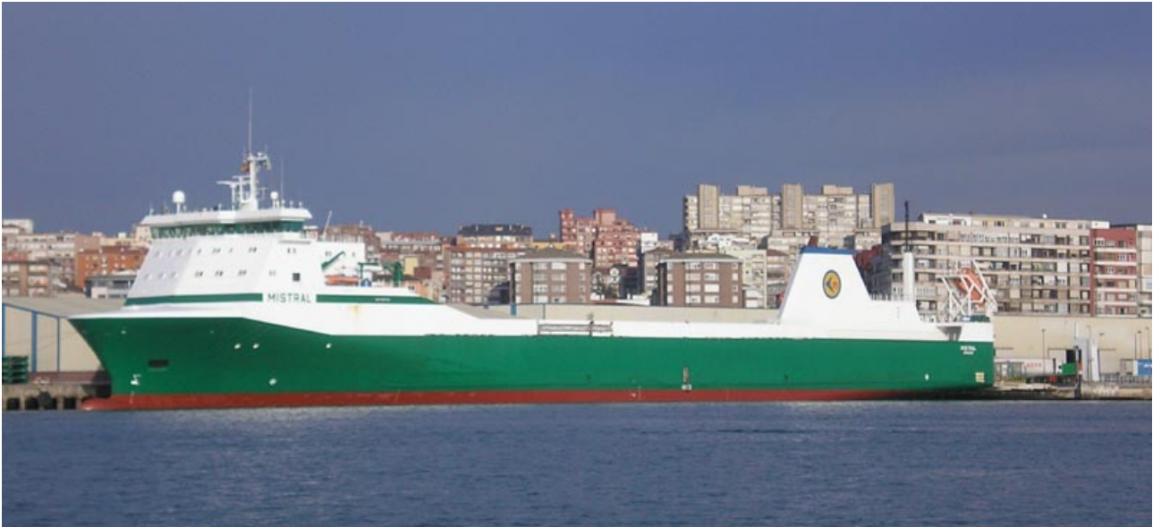
MISTRAL , en Santander el 20 Diciembre 2007