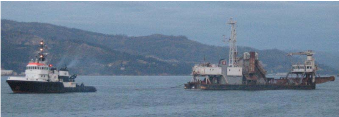
LUNA A y AMAZONE , en la ría de Vigo el 20 Diciembre 2007