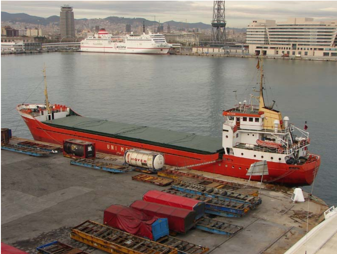
ISABEL I , en Barcelona el 14 Enero 2008