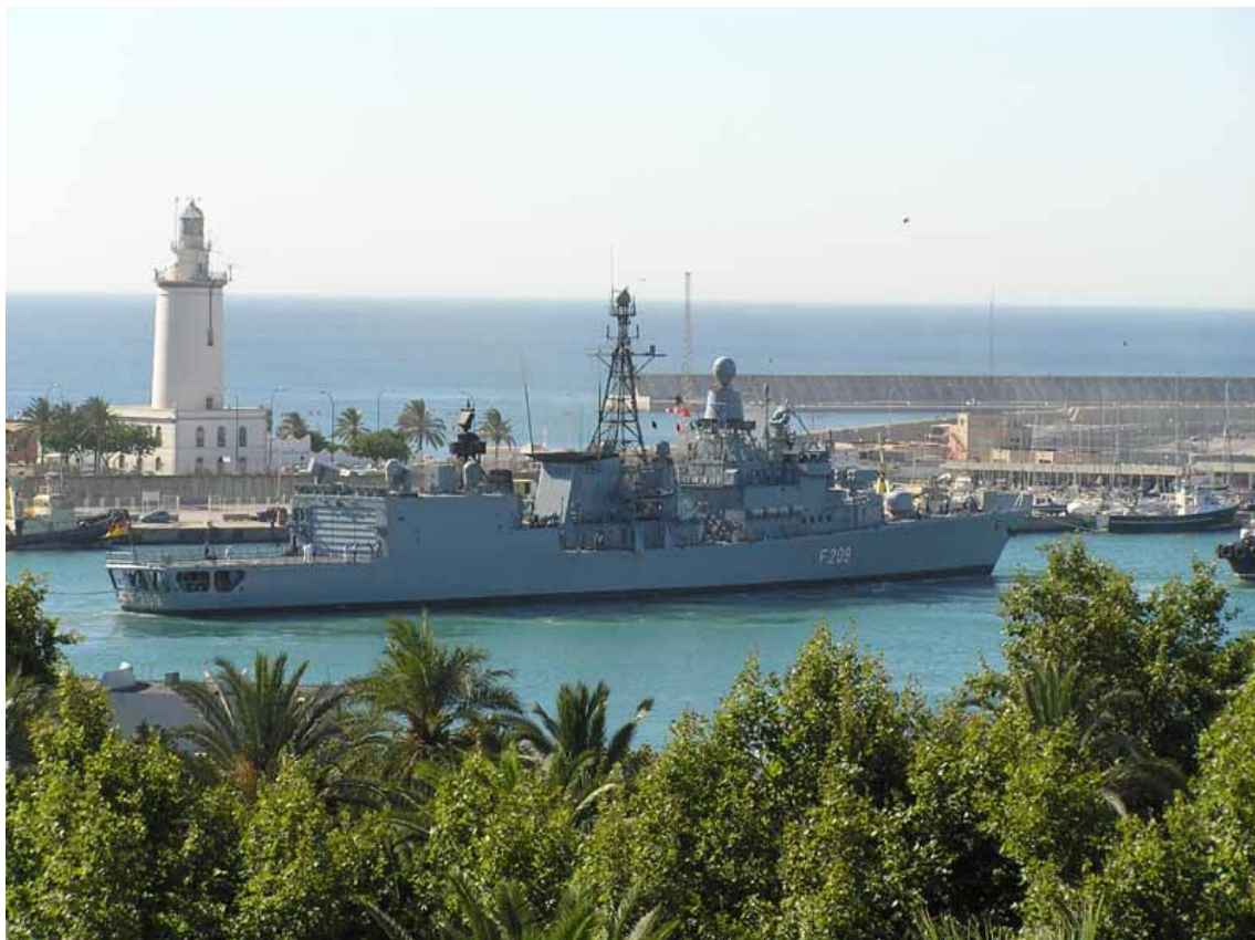
RHEINLAND PFALZ, en Málaga el 29 Julio 2005