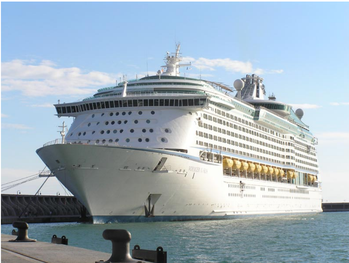
VOYAGER OF THE SEAS, en Málaga el 25 Noviembre 2007 - ©Dr. Juan Carlos Cilveti Puche