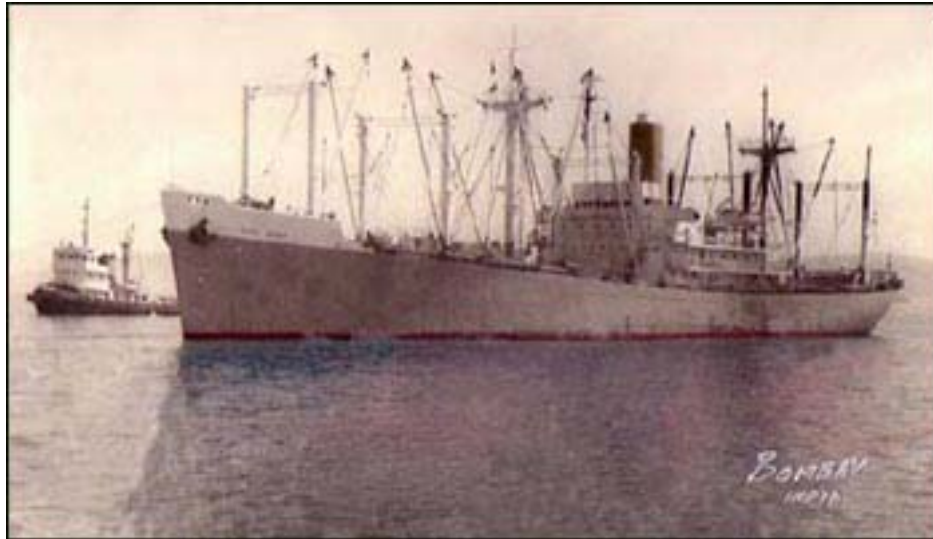
STEEL MAKER

A pesar de los esfuerzos de la tripulación, la situación del MONTE PALOMARES no mejoraba. Pasadas las cuatro de la tarde se tocaron las señales de abandono. Todos los hombres, con los chalecos salvavidas puestos, se prepararon para arriar los botes salvavidas. El de babor, que era de motor, se destrozó en la maniobra al impactar sobre el casco del buque. Con el de estribor, dotado de remos, fueron mejor las cosas y pudo arriarse con 16 hombres a bordo. Los 22 hombres restantes se concentraron en la popa esperando el momento oportuno para lanzarse al agua hacia el bote salvavidas que les esperaba, o bien, utilizar las dos balsas de corcho y goma, con capacidad para diez personas cada una. Mientras, el buque permanecía escorando soportando el tremendo temporal que no dejaba de complicar las cosas. El tiempo transcurría y pasadas las cinco de la tarde las balsas se desprendieron de sus anclajes, cayendo al agua. Algunos tripulantes se lanzaron a la mar y otros fueron arrojados por las olas, consiguiendo alcanzarlas y embarcar, pero otros menos decididos optaron por permanecer a bordo.