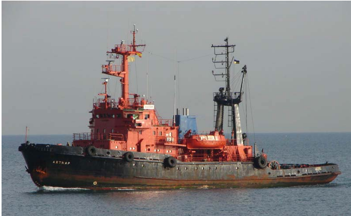
AKHTIAR , en Barcelona el 3 Diciembre 2007 - ©Jordi Montoro Fort