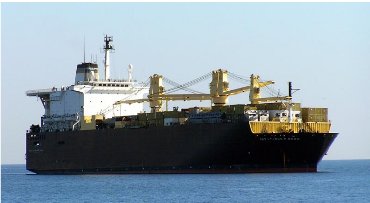
2ND LT JOHN P BOBO, fondeado frente a Málaga el 10 Diciembre 2007