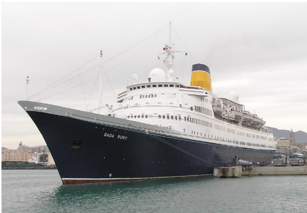
SAGA RUBY , en Málaga el 24 Noviembre 2007