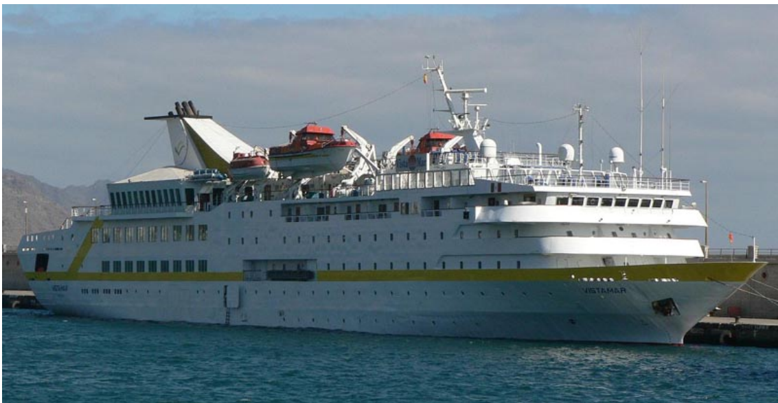
VISTAMAR en Santa cruz de Tenerife el 7 Diciembre 2007 - ©Julio Antonio Rodríguez Hermosilla

071207 Escala del VISTAMAR en Santa Cruz de Tenerife en viaje de Arrecife de Lanzarote a Mindelo