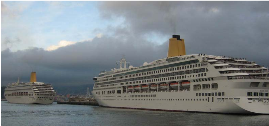
ORIANA y AURORA, en Vigo el 5 Diciembre 2007

071205 Coinciden por primera vez en Vigo dos buques de la P&O. Se trata del AURORA y el ORIANA que con tal motivo permanecieron engalanados durante su estancia y protagonizaron una sonora despedida al zarpar juntos