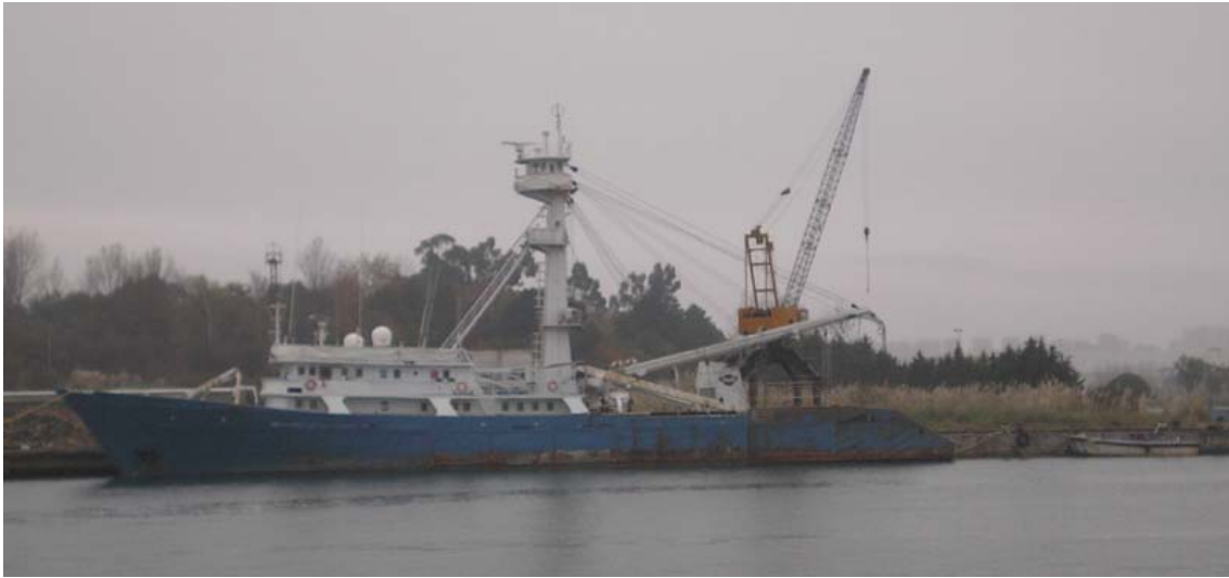
TXORI EDER, en el muelle de desguaces el 20 Noviembre 2007