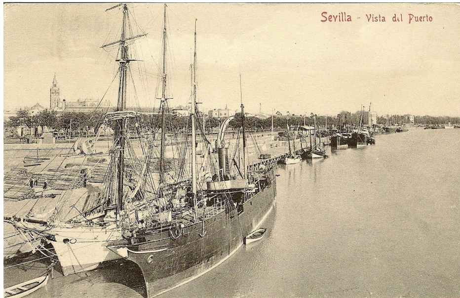
Buques atracados en el puerto de Sevilla. (Archivo Manuel Rodríguez Aguilar).