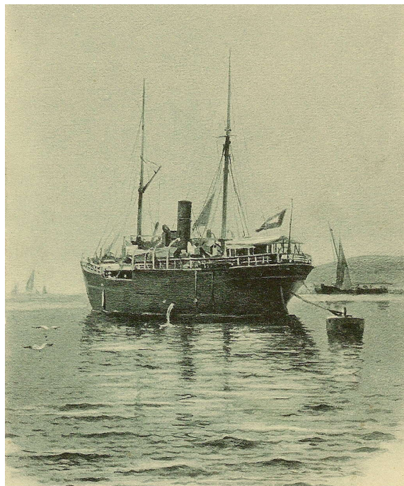
El TORRE DEL ORO (.