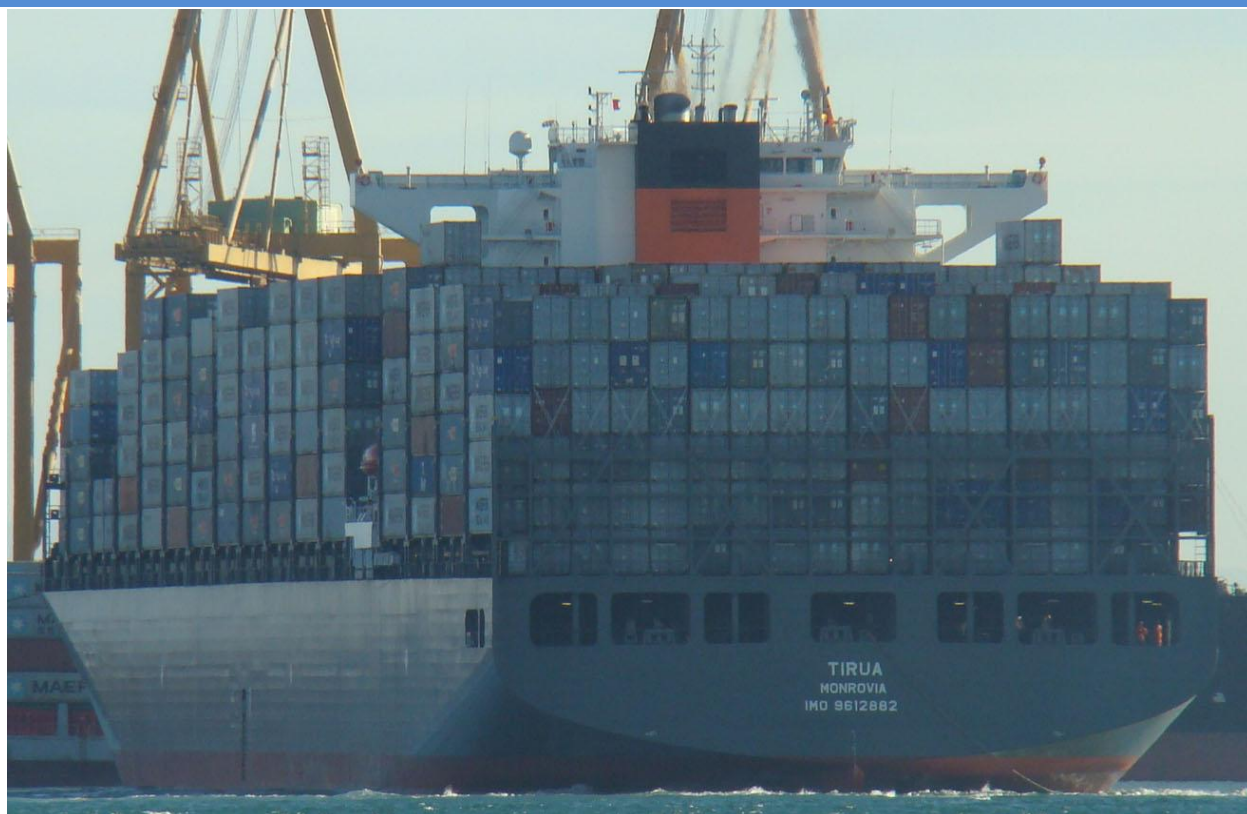
TIRUA , en Valencia el 14 Septiembre 2012

120914 Primera escala en Valencia del COSTA FORTUNA (9239783), de Barcelona para Palma de Mallorca con pasaje