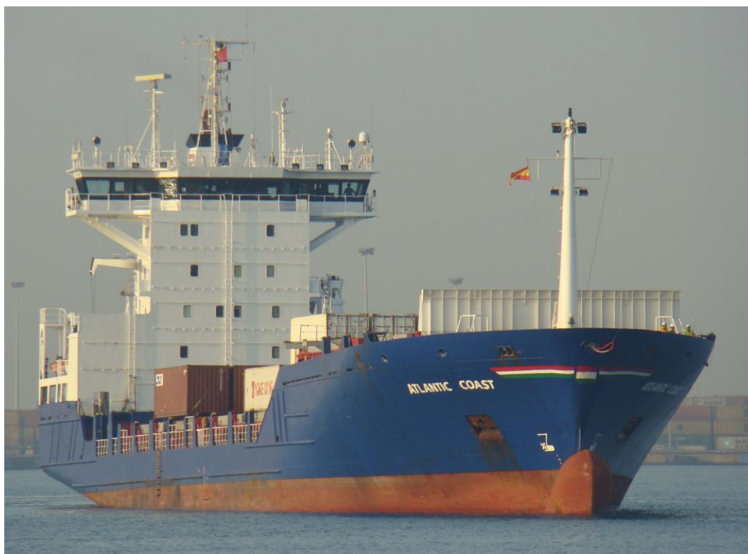
ATLANTIC COAST , en Valencia el 11 Septiembre 2012

120911 Primera escala en Valencia del ATLANTIC COAST (9129469) de Tarragona para Rades con contenedores