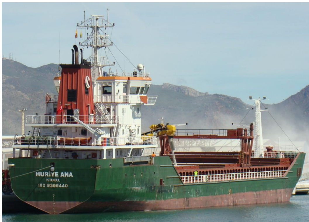
HURIYE ANA , en Castellón el 13 Septiembre 2012