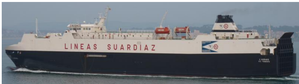
L'AUDACE en Santander el 10 Septiembre 2012

120910 Escala en Santander de L'AUDACE (9187318) de Southampton para Zeebrugge, carga vehículos