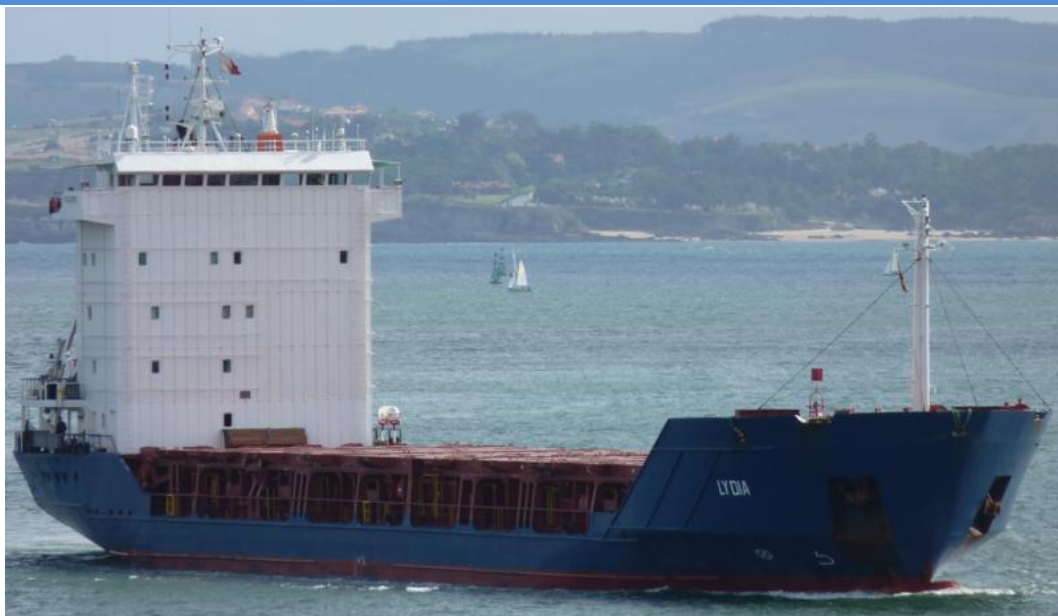
LYDIA en Santander el 29 Septiembre 2012

120929 Primera escala en Valencia del EMPRESS (8716899) de Almería para Valletta con pasaje