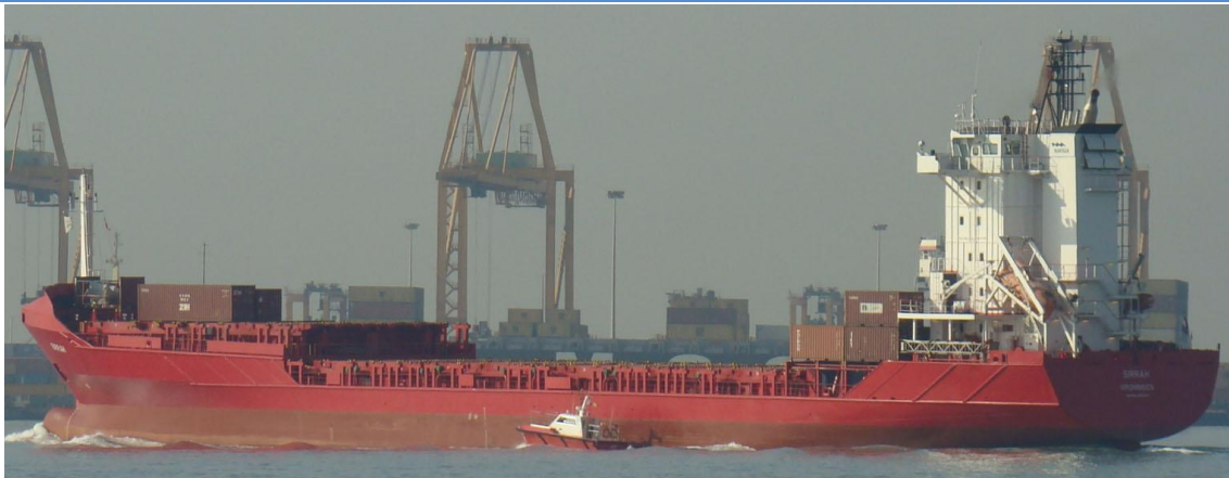
SIRRAH , en Valencia el 12 Septiembre 2012