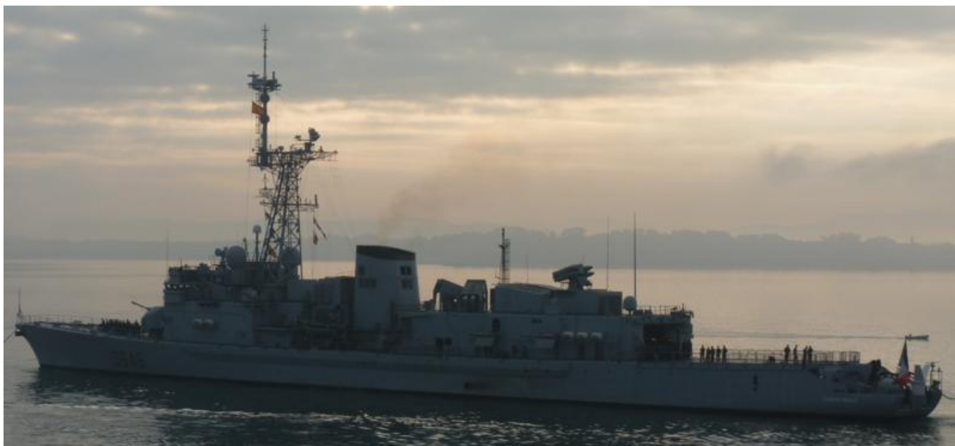
LATOUCHE TREVILLE en Santander el 17 Septiembre 2012

120913 Escala en Santander del buque de la Marina Francesa LATOUCHE TREVILLE