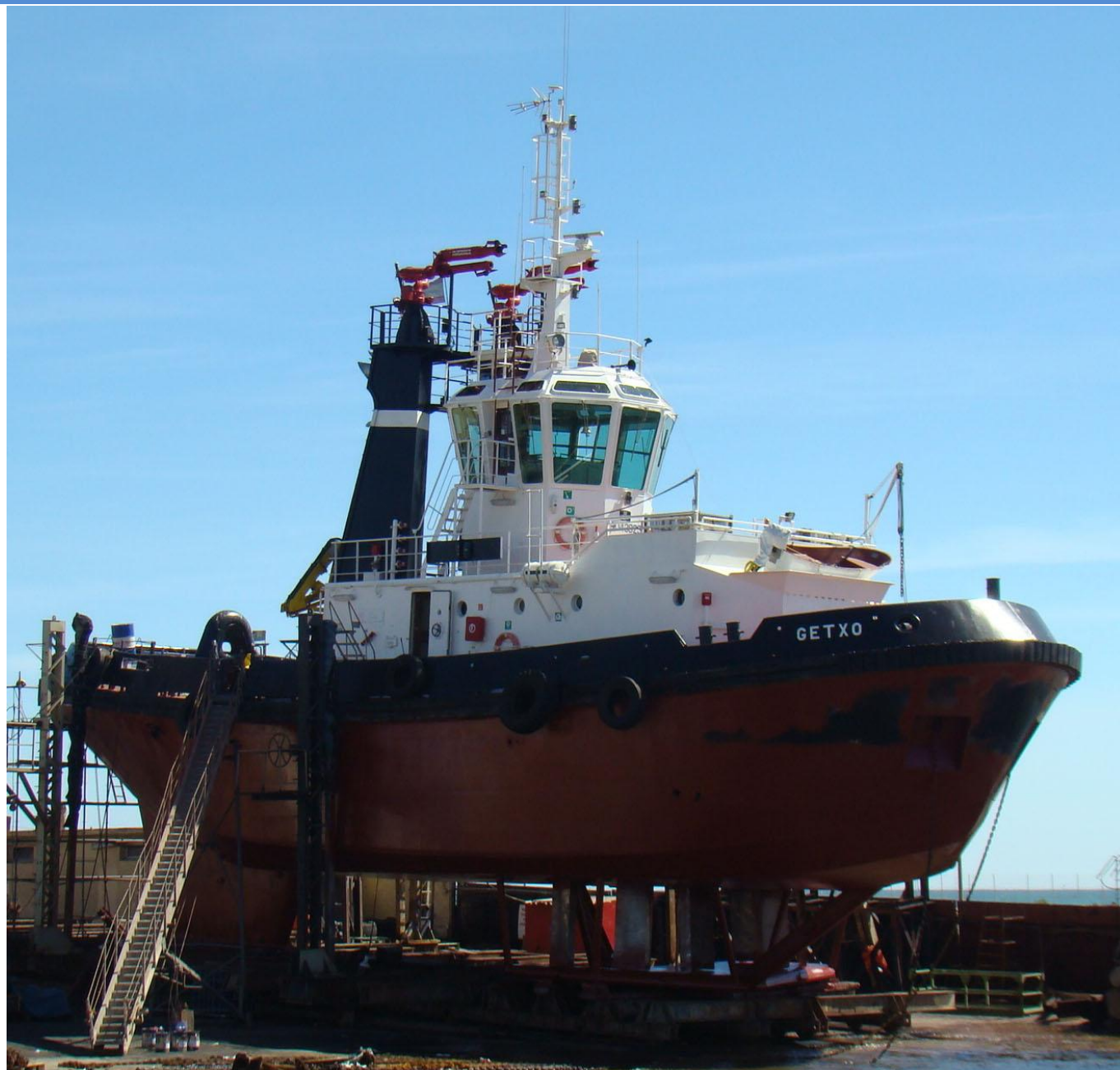
GETXO , en Burriana el 14 Septiembre 2012

Boletín de la SUCURSAL ESPAÑOLA WORLD SHIP SOCIETY