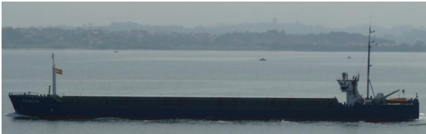
REMORA en Santander el 11 Septiembre 2012

120911 Escala en Huelva del BRENS (9147887) con madera desde Brens, zarpa a órdenes.