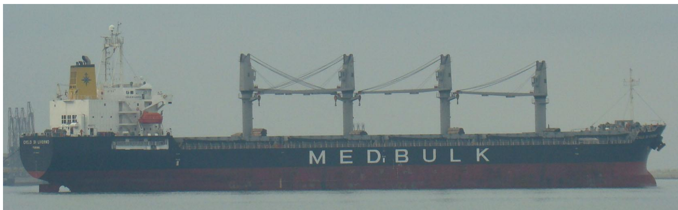
CIELO DI LIVORNO , en Castellón el 18 Septiembre 2012

120918 Primera escala en Castellón del CIELO DI LIVORNO (9380829), carga coke de petróleo