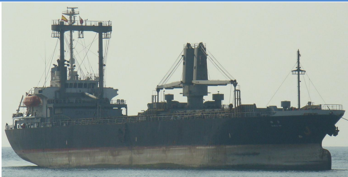
NOBLE SW , en Castellón el 10 Septiembre 2012

120911 Primera escala en Valencia del ATLANTIC COAST (9129469) de Tarragona para Rades con contenedores