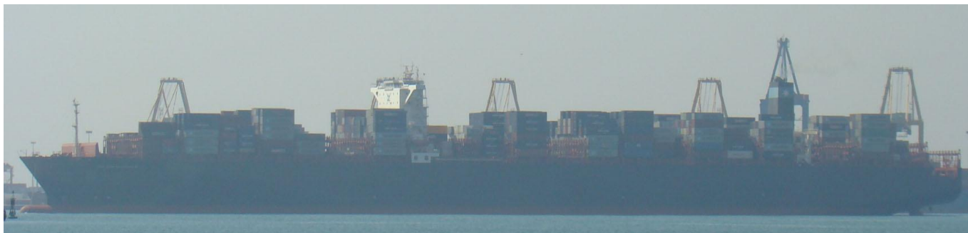
CMA CGM EFFINGHAM , en Valencia el 12 Septiembre 2012

120911 Primera escala en Valencia del CMA CGM EFFINGHAM (9463059), de Marsaxlokk para Barcelona con contenedores