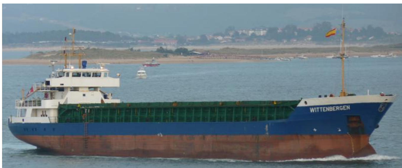
WITTENBERGEN en Santander el 22 Septiembre 2012