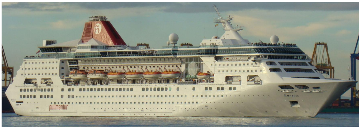
EMPRESS , en Valencia el 29 Septiembre 2012

120929 Primera escala en Valencia del EMPRESS (8716899) de Almería para Valletta con pasaje