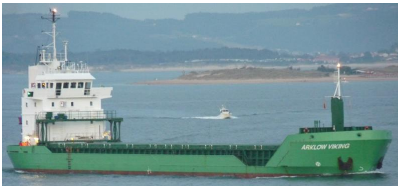
ARKLOW VIKING en Santander el 22 Septiembre 2012

120922 Escala en Algeciras del CASTILLO DE VIGO (9071832), procedente de Koper. Zarpa para Port Kamsar.