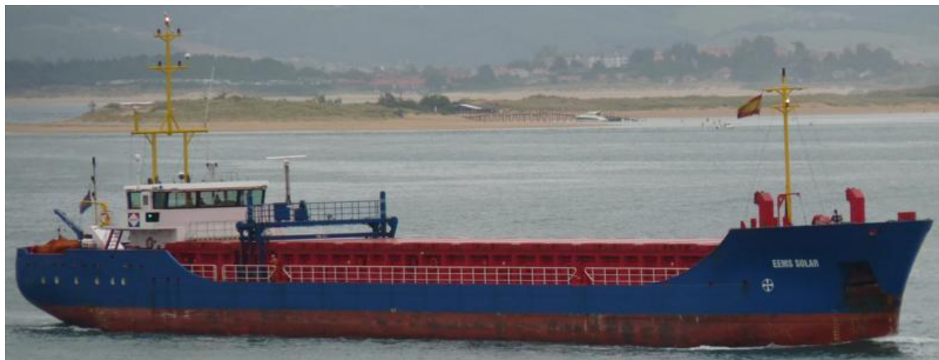
EEMS SOLAR en Santander el 28 Septiembre 2012