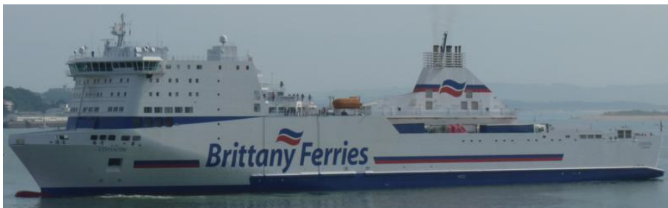
COTENTIN en Santander el 16 Septiembre 2012

120916 Escala en Algeciras del GUANARTEME (9280134), procedente de Las Palmas. Zarpa a órdenes.