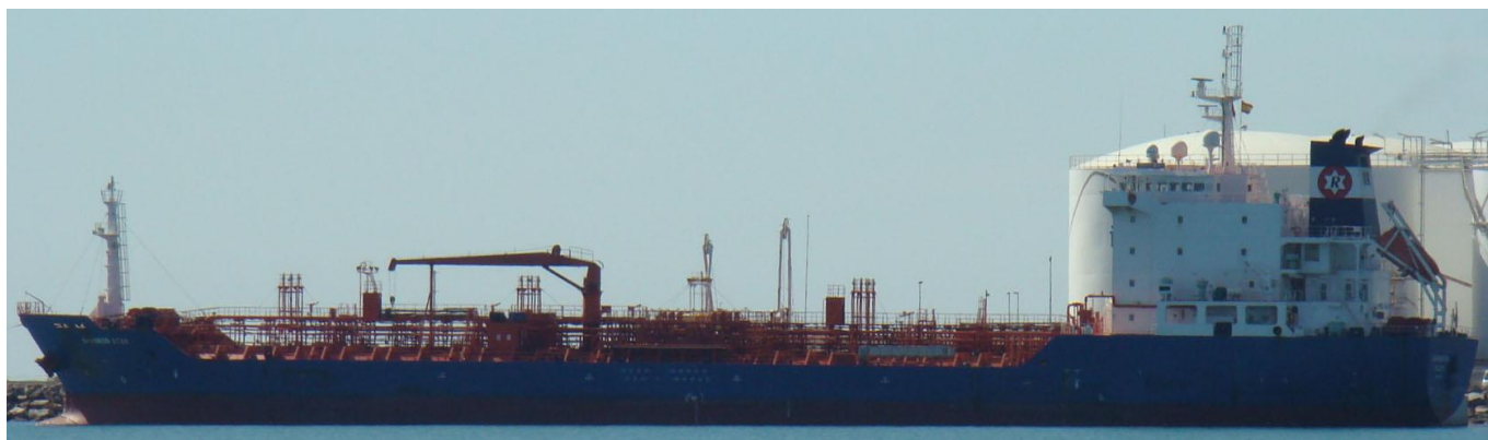
SHANNON STAR , en Castellón el 14 Septiembre 2012

120914 Primera escala en Castellón del SHANNON STAR (9503926)