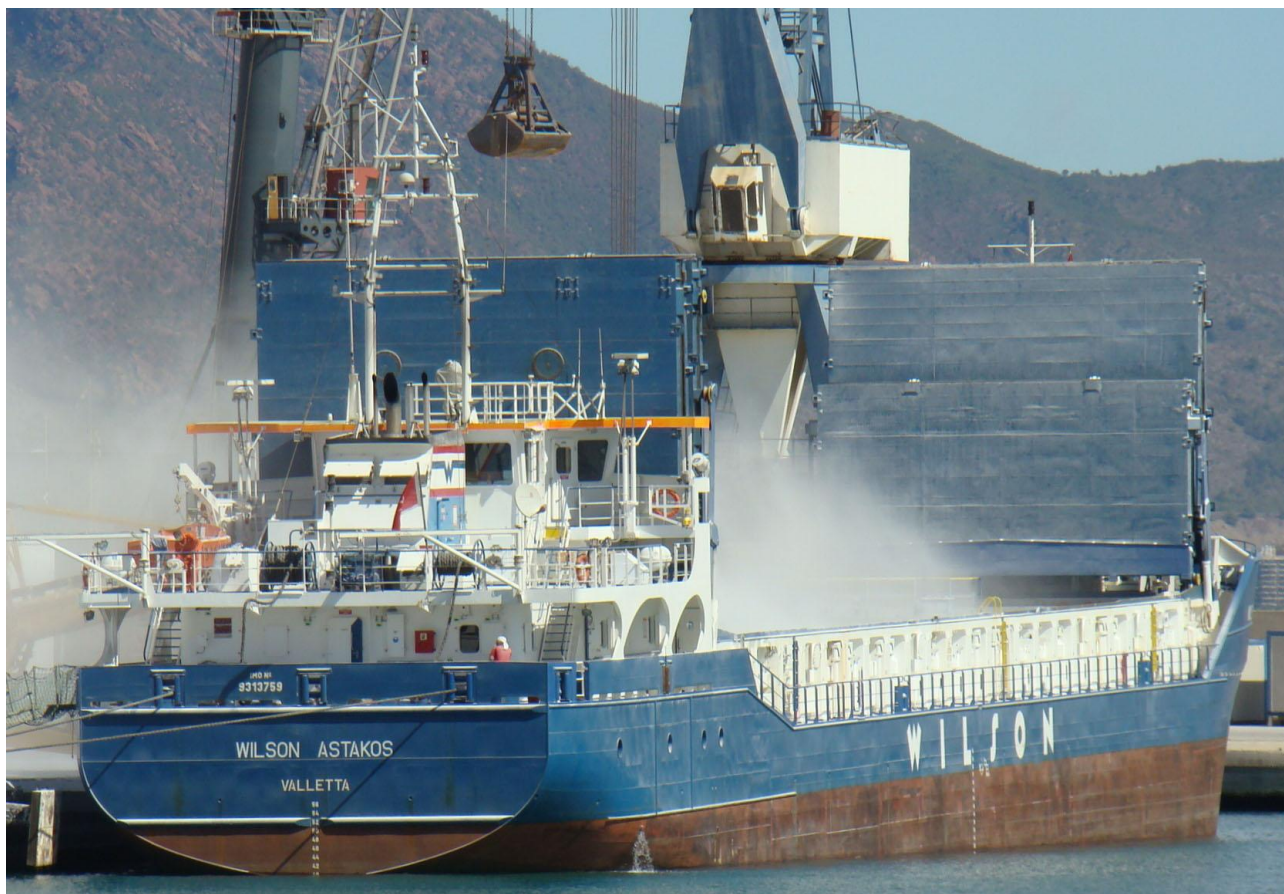
WILSON ASTAKOS , en Castellón el 14 Septiembre 2012 - ©Jose Miralles Pol

120914 Primera escala en Castellón del WILSON ASTAKOS (9313759), carga abono