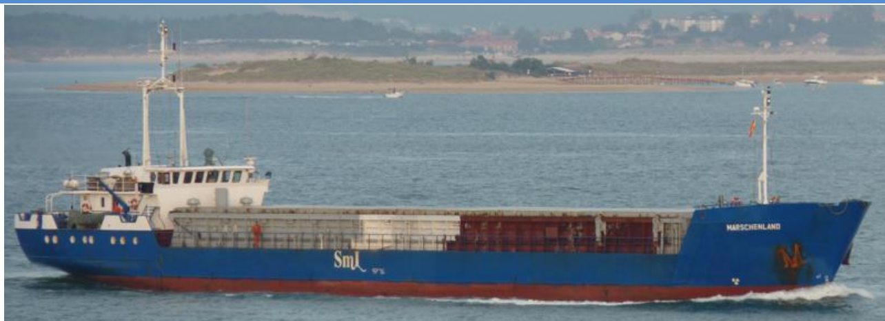
MARSCHENLAND en Santander el 22 Septiembre 2012

120922 Escala en Algeciras del CASTILLO DE VIGO (9071832), procedente de Koper. Zarpa para Port Kamsar.