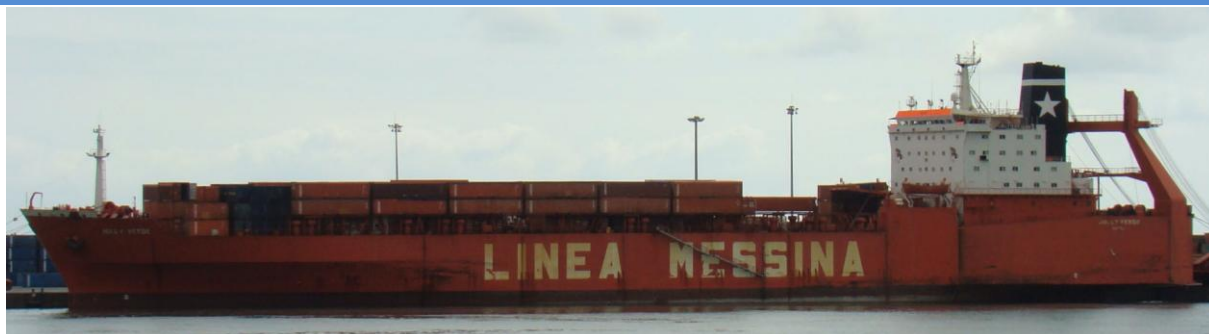
JOLLY VERDE , en Castellón el 20 Septiembre 2012

120920 Escala en Algeciras del BERCEO (8818805), procedente de Ceuta. Zarpa para Amberes.