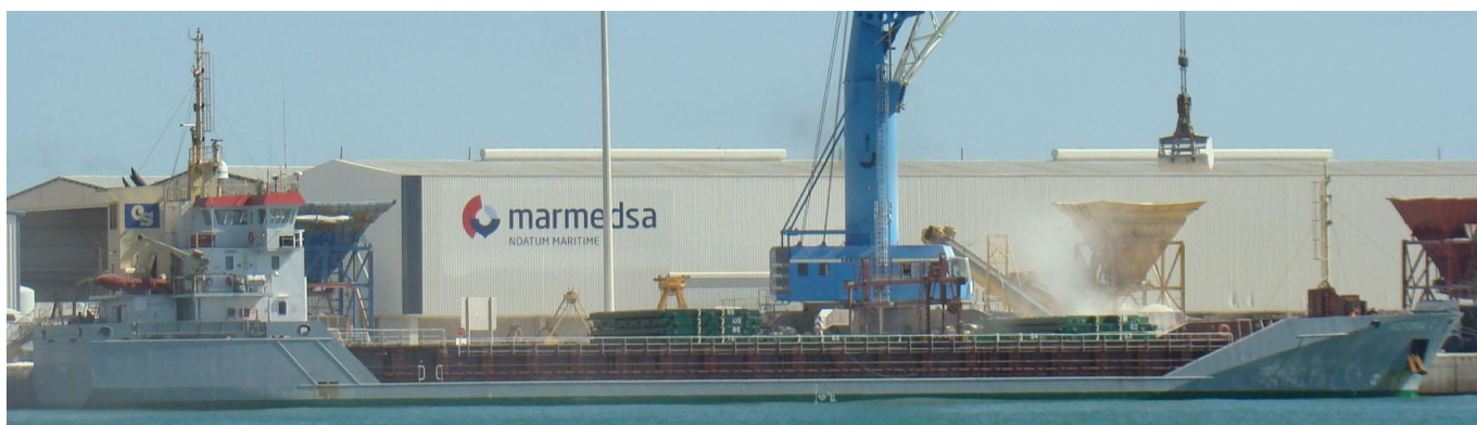
VICTORIA-C , en Castellón el 25 Septiembre 2012