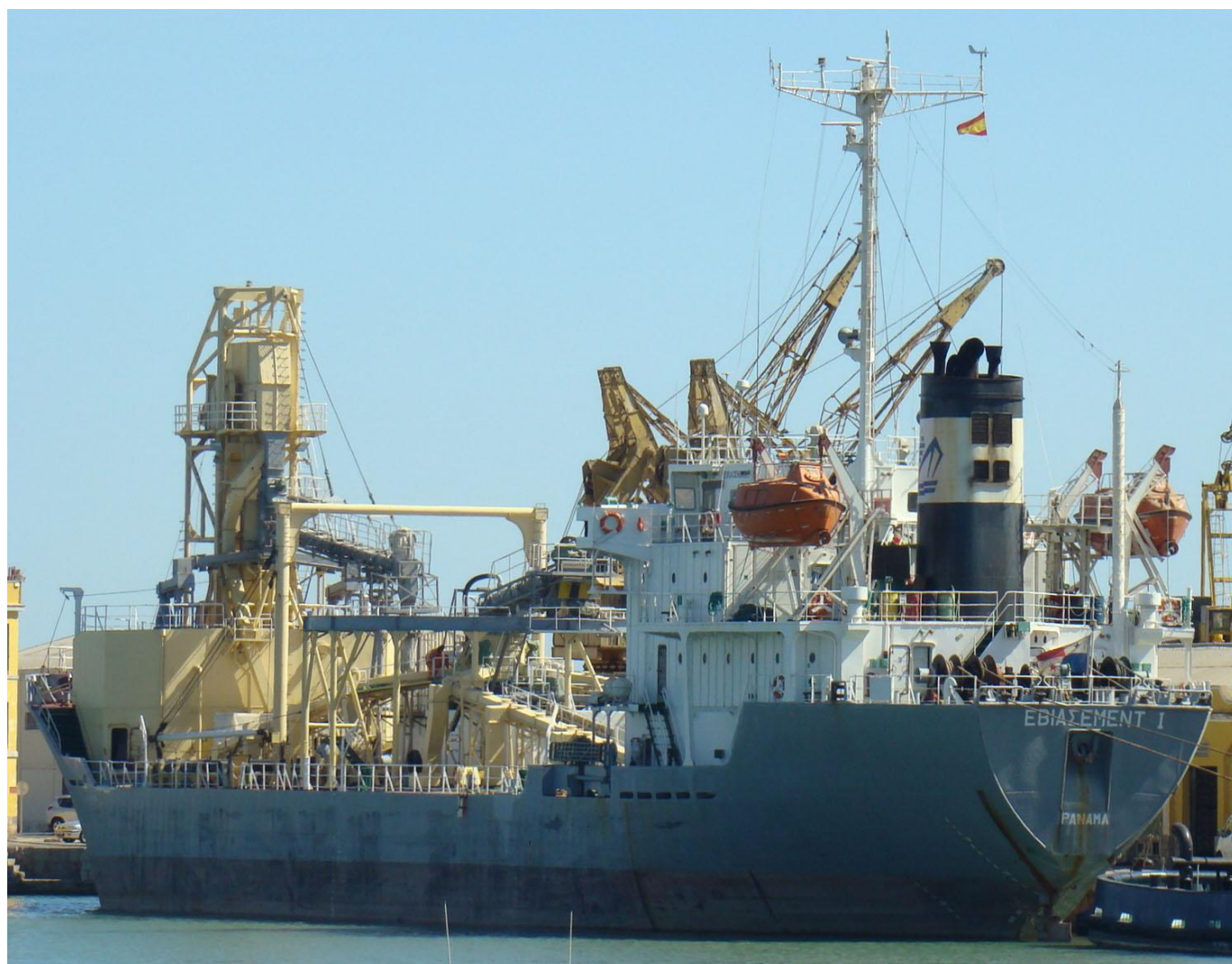
EVIACEMENT I , en Burriana el 14 Septiembre 2012