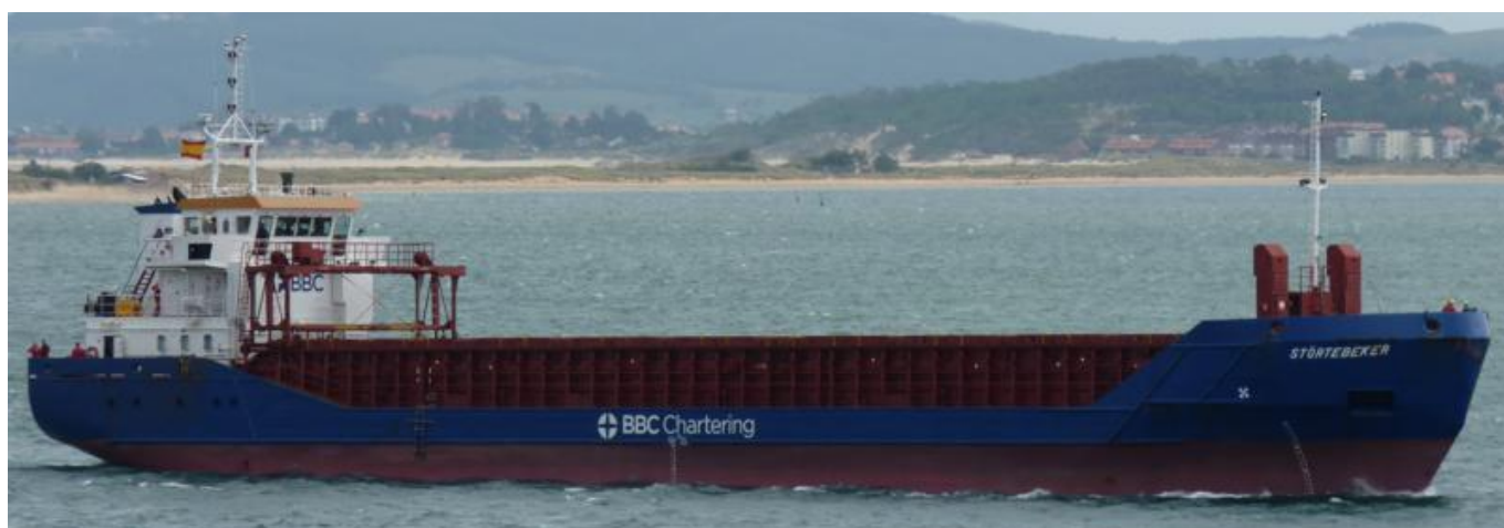
STÖRTEBEKER en Santander el 23 Septiembre 2012

120923 Primera escala en Santander del STORTEBEKER (9195377) de Foynes para Glasgow, carga equipos eólicos