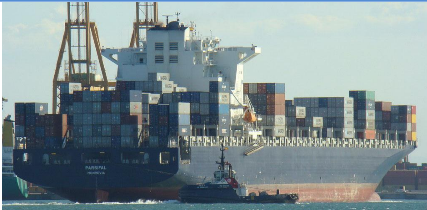
PARSIFAL , en Valencia el 4 Septiembre 2012