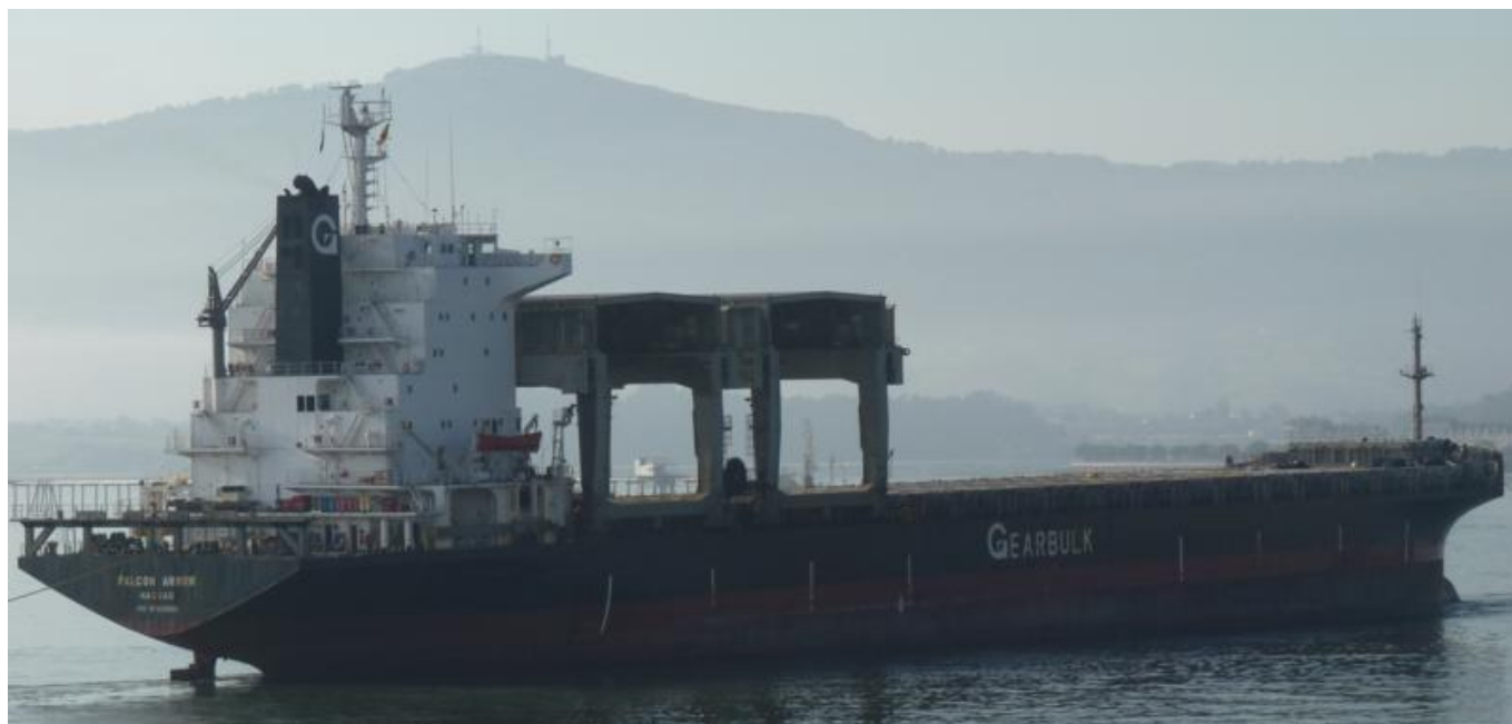
FALCON ARROW en Santander el 16 Septiembre 2012