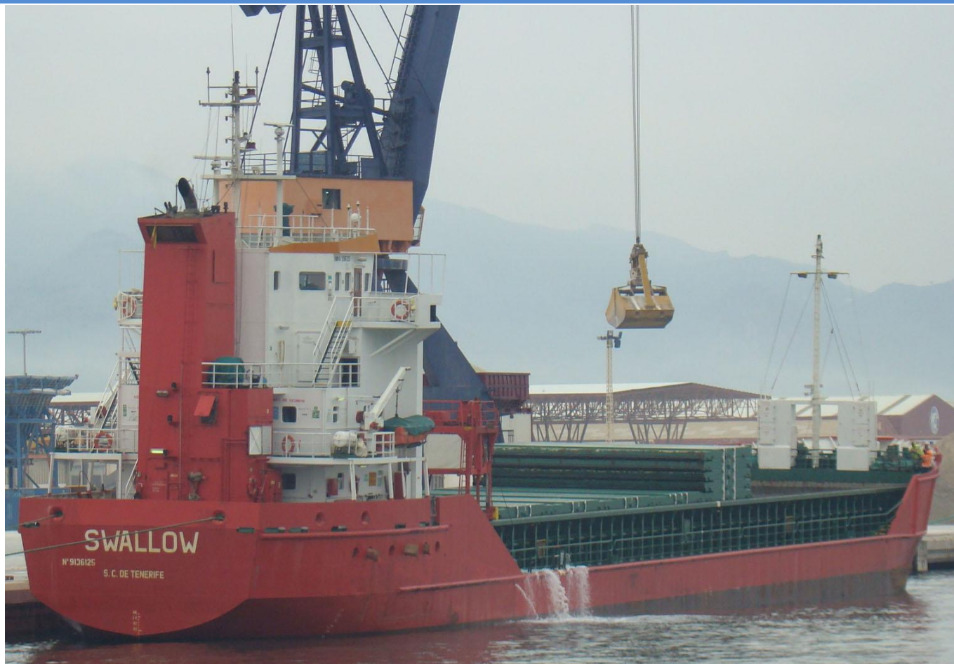
SWALLOW , en Castellón el 18 Septiembre 2012