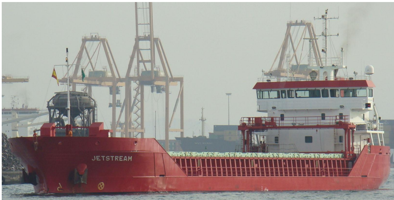
JETSTREAM , en Valencia el 23 Septiembre 2012

120923 Primera escala en Valencia del JETSTREAM (9356579) de Fos para Rotterdam descarga cebada y carga granel