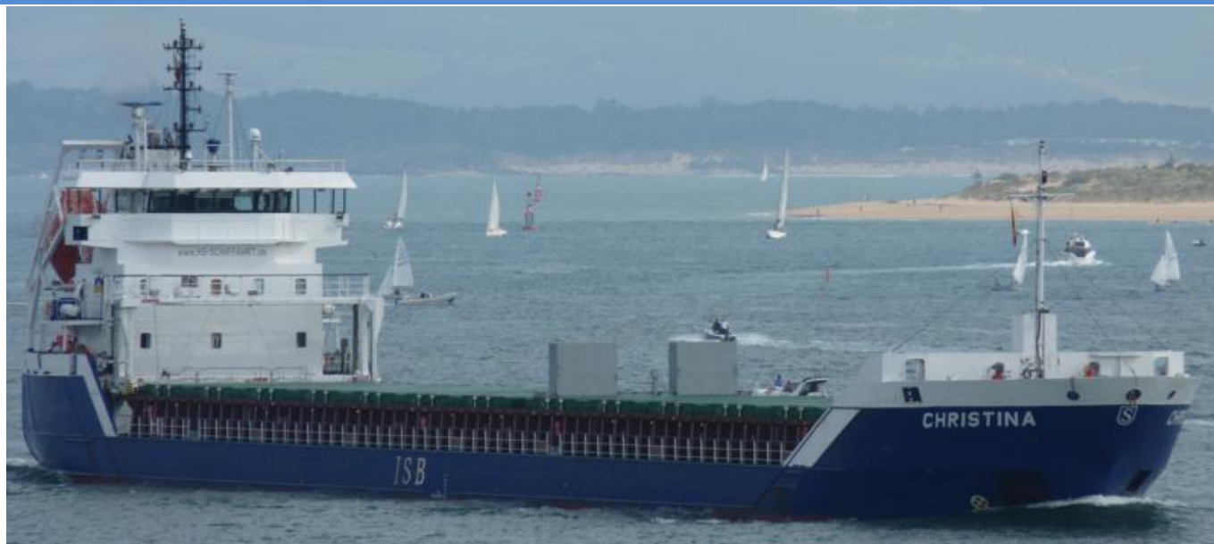
CHRISTINA en Santander el 16 Septiembre 2012

120916 Escala en Algeciras del GUANARTEME (9280134), procedente de Las Palmas. Zarpa a órdenes.