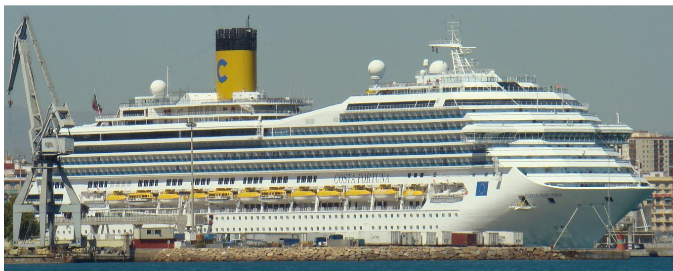
COSTA FORTUNA , en Valencia el 14 Septiembre 2012

120914 Primera escala en Valencia del COSTA FORTUNA (9239783), de Barcelona para Palma de Mallorca con pasaje