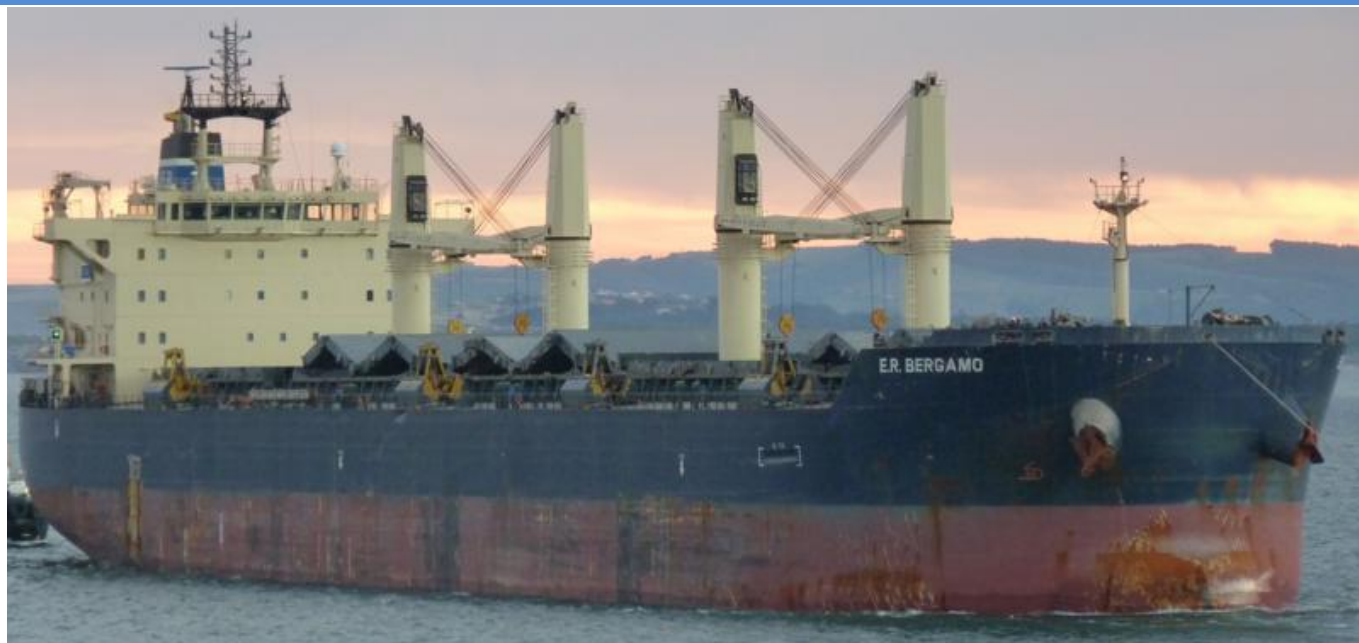
E.R. BERGAMO en Santander el 23 Septiembre 2012

120923 Primera escala en Santander del KONINGSBORG (9155925) de Montoir para Avilés y Chicago, carga alambón