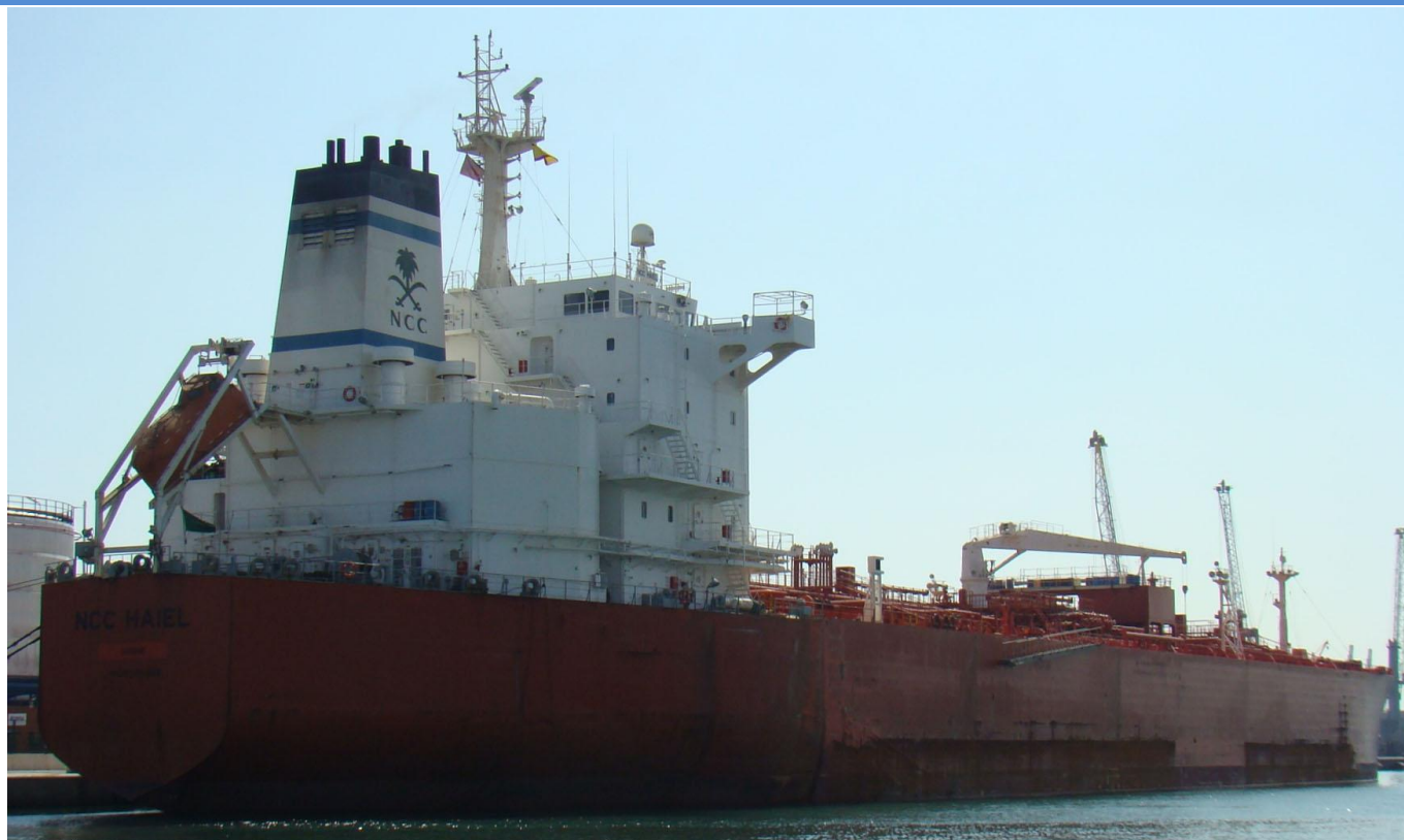
NCC HAIEL , en Valencia el 22 Septiembre 2012