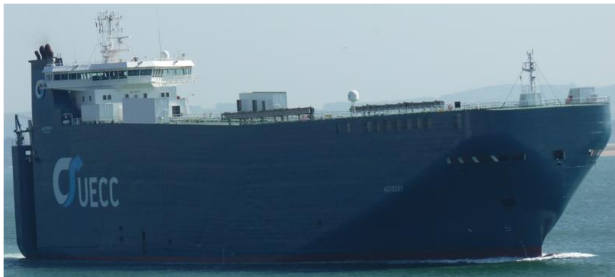
AUTOSKY en Santander el 21 Septiembre 2012

120920 Escala en Algeciras del BERCEO (8818805), procedente de Ceuta. Zarpa para Amberes.