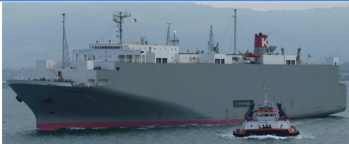
AFRICAN HIGHWAY en Santander el 10 Septiembre 2012

120910 Escala en Santander de L'AUDACE (9187318) de Southampton para Zeebrugge, carga vehículos