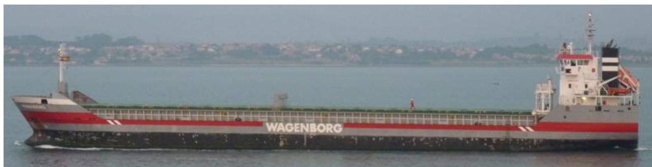
HUMBERBORG en Santander el 10 Septiembre 2012

120910 Escala en Santander del DEUTSCHLAND (9141807) de Bilbao para Coruña con pasaje