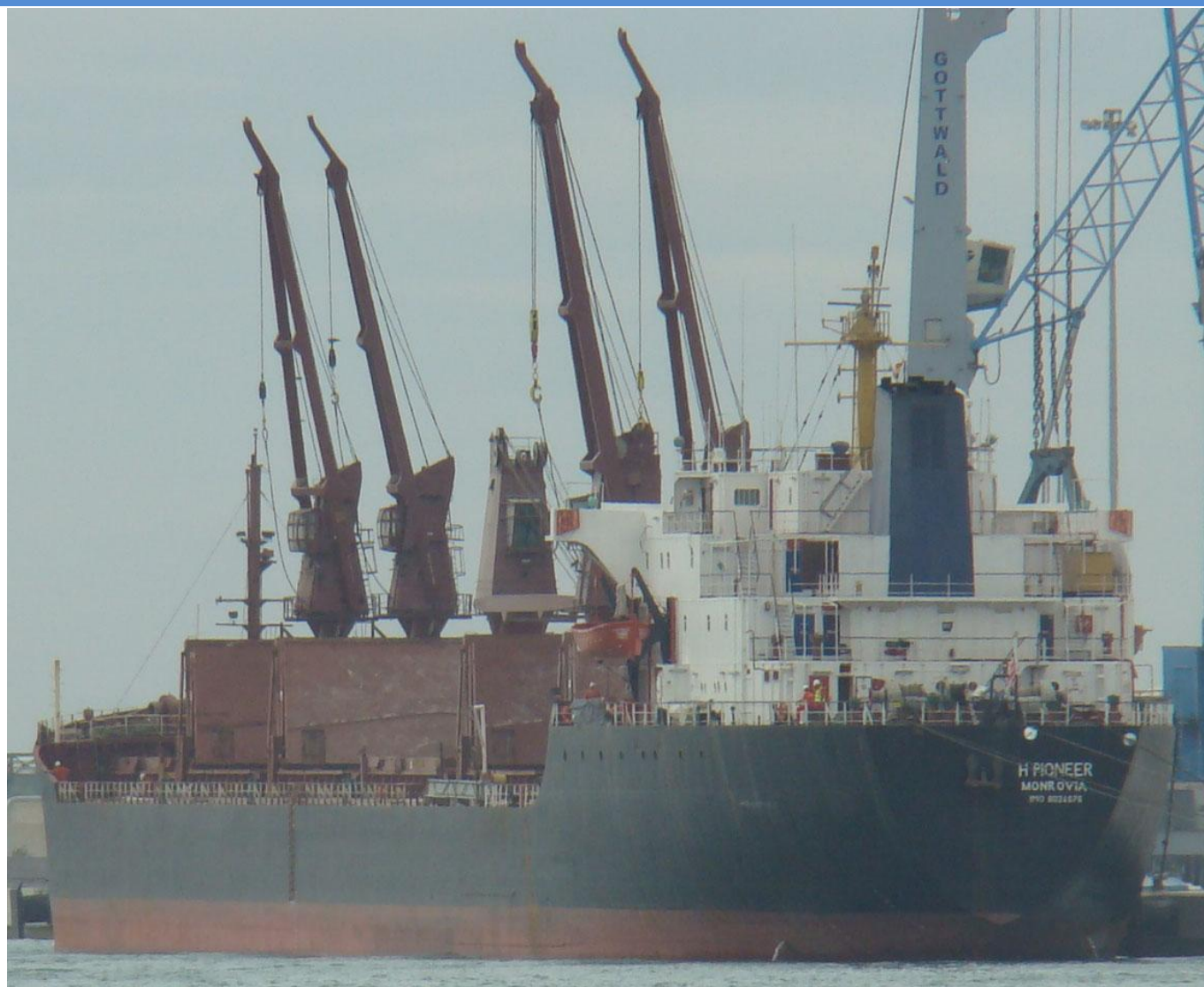
H PIONEER , en Castellón el 26 Septiembre 2012