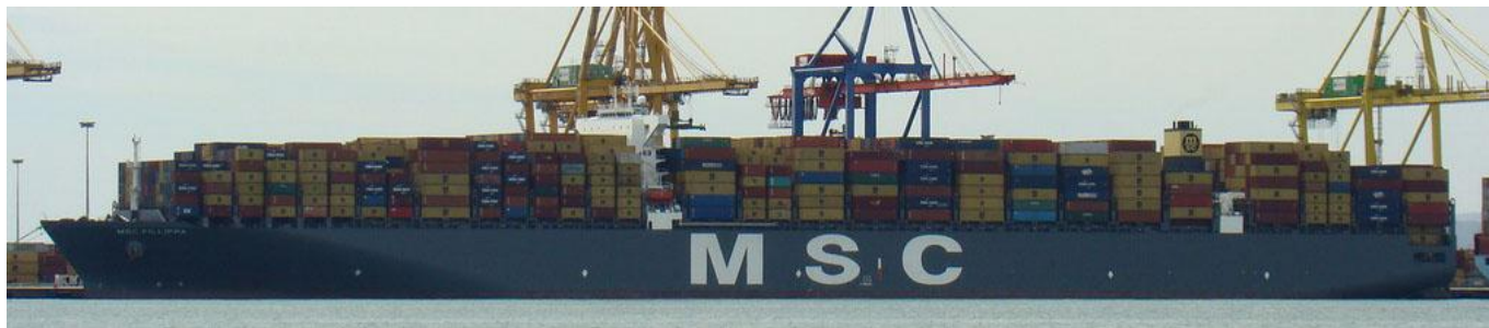
MSC FILLIPPA , en Valencia el 1 Septiembre 2012